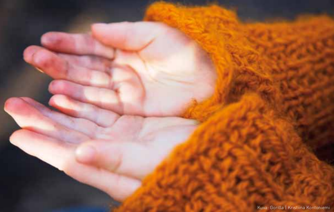
Kuva: Gorilla | Kristiina Kontoniemi