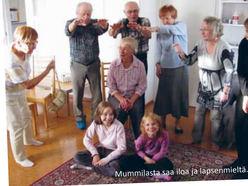
Mummilasta saa iloa ja lapsenmieltä.