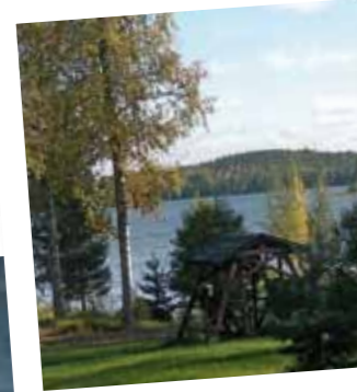
Pistäytymisen mökillä sunnuntaina rauhoittaa.