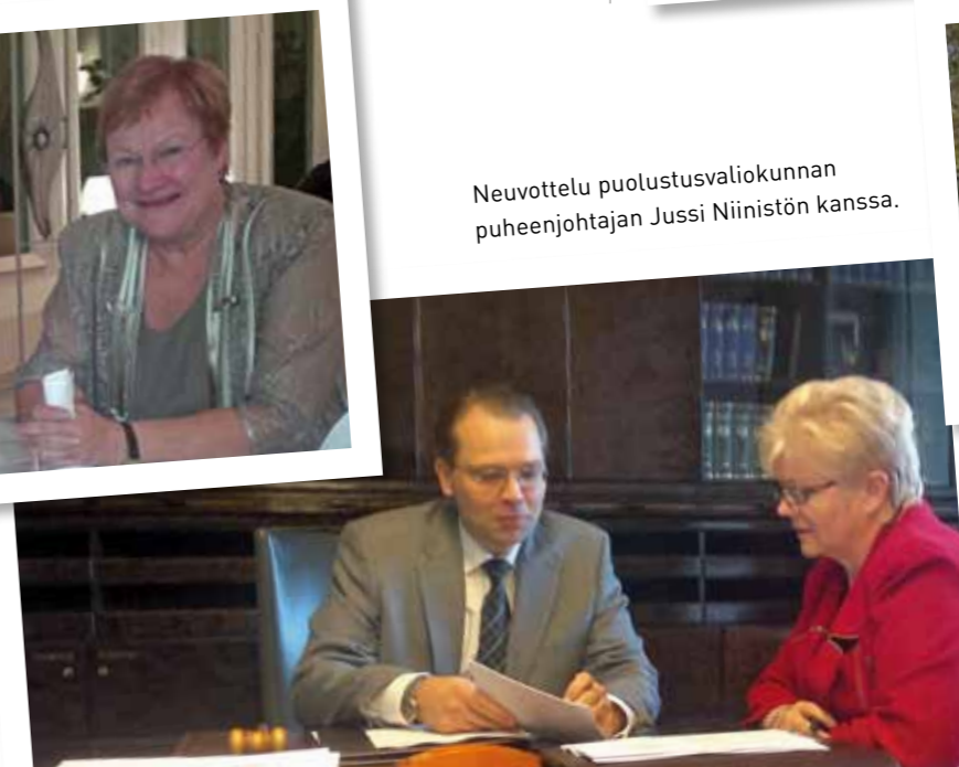
Neuvottelu puolustusvaliokunnan puheenjohtajan Jussi Niinistön kanssa.

Illalla ryhmämme vieraillee Ylessä. Tutustumme urheilutoimitukseen ja harjoittelemme selostamista. Yle tarvitsee toiminnalleen pysyvän rahoituksen.