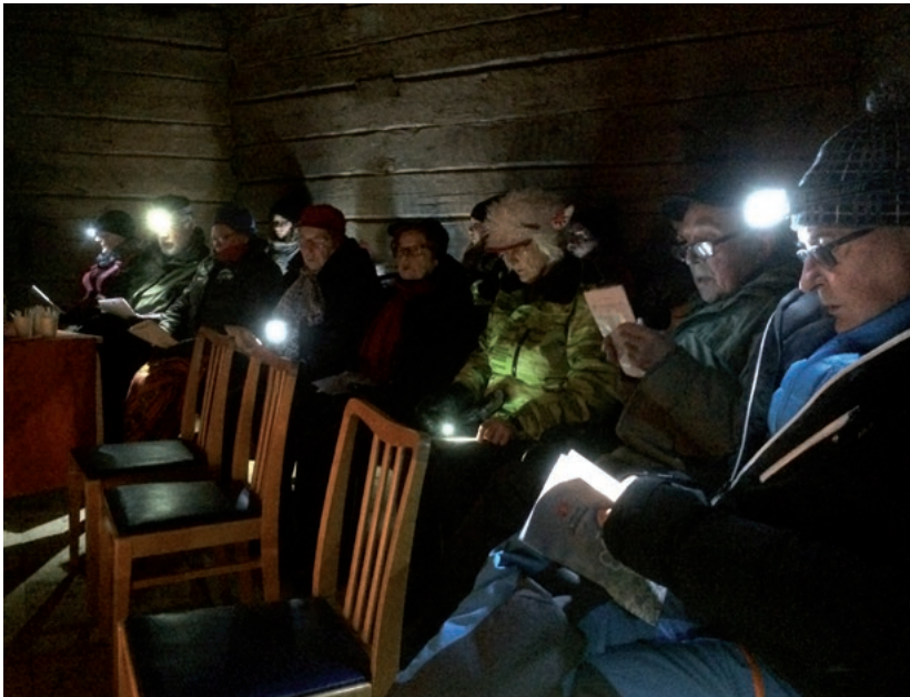
Tunnelmallinen virsilauluilta Läpikäytävässä otsalamppujen loisteessa.