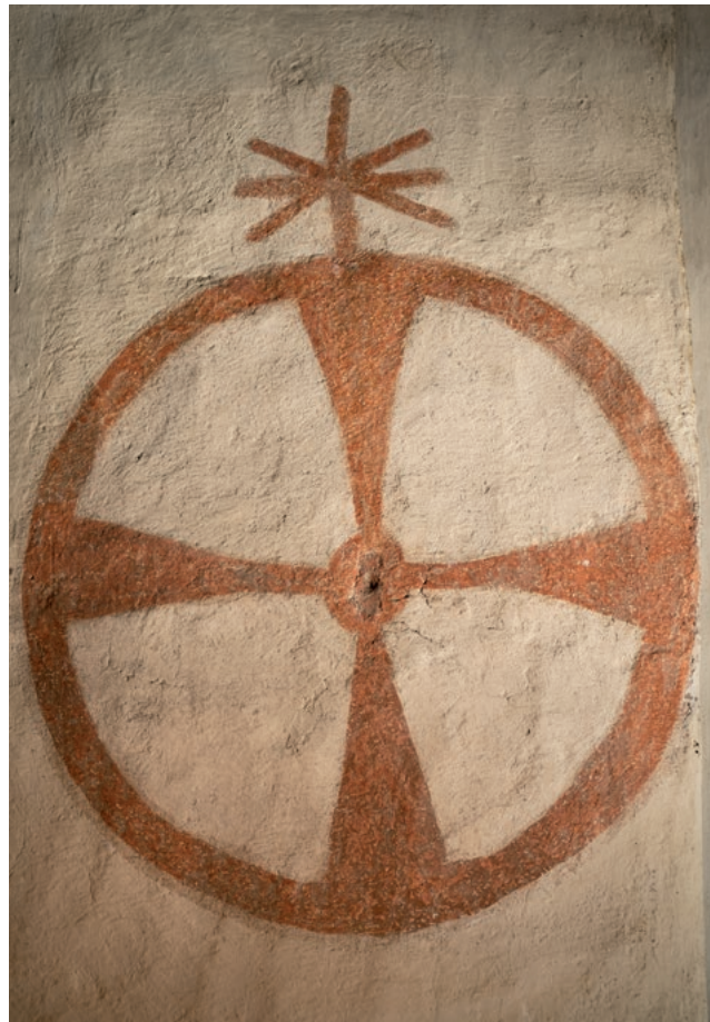
Hollolan kirkon alttaripäädyn keskiaikainen vihkiristi palvelee Hollolan seurakuntaa myös sen logona, yhteisön tunnuksena.

Paikallisseurakuntaelämän hyvin tuntevien kirjoittajien lähihistoriateos maalaa elävän ja rikkaan kuvan viidestä erilaisesta ja erikokoisesta seurakunnasta, jotka löysivät kahdessa eri vaiheessa yhteisen tien. Sitä pitkin ne ovat päättäneet kulkea kohti tulevia aikoja yhtenä ainutlaatuisena Hollolan evankelisluterilaisena seurakuntana.