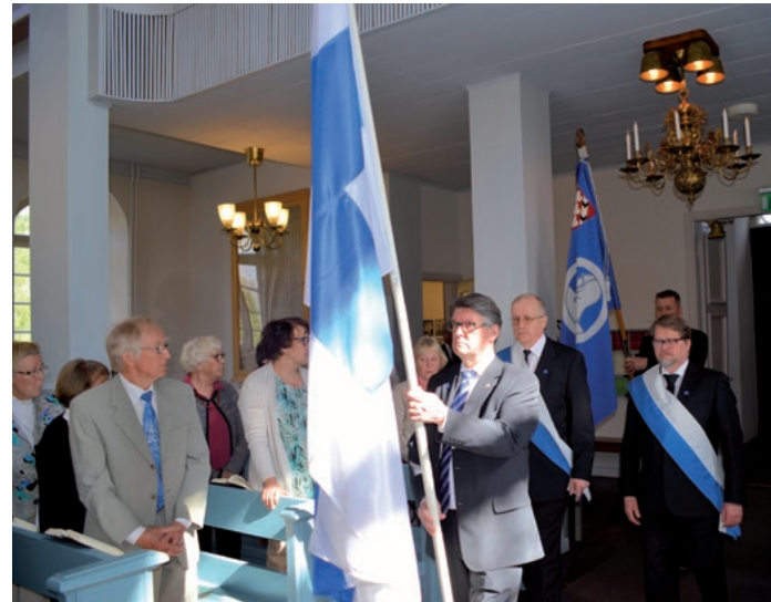
Kaatuneitten muistopäivänä liput saapuvat jumalanpalvelukseen. (HJ)

Hämeenkosken kunta ja seurakunta ovat tehneet yhteistyötä itsenäisyyspäivän juhla-tilaisuuksissa, sepeleenlaskuissa sekä kaatuneitten muistopäivän tilaisuuksissa. Kuntaliitoksen jälkeen yhteistyö kunnan kanssa on loppunut. Tätä yhteistyötä jatkaa nykyisin Koski-seura. Näin pitäjän identiteetti säilyy nykytilannetta ja perinteitä unohtamatta.