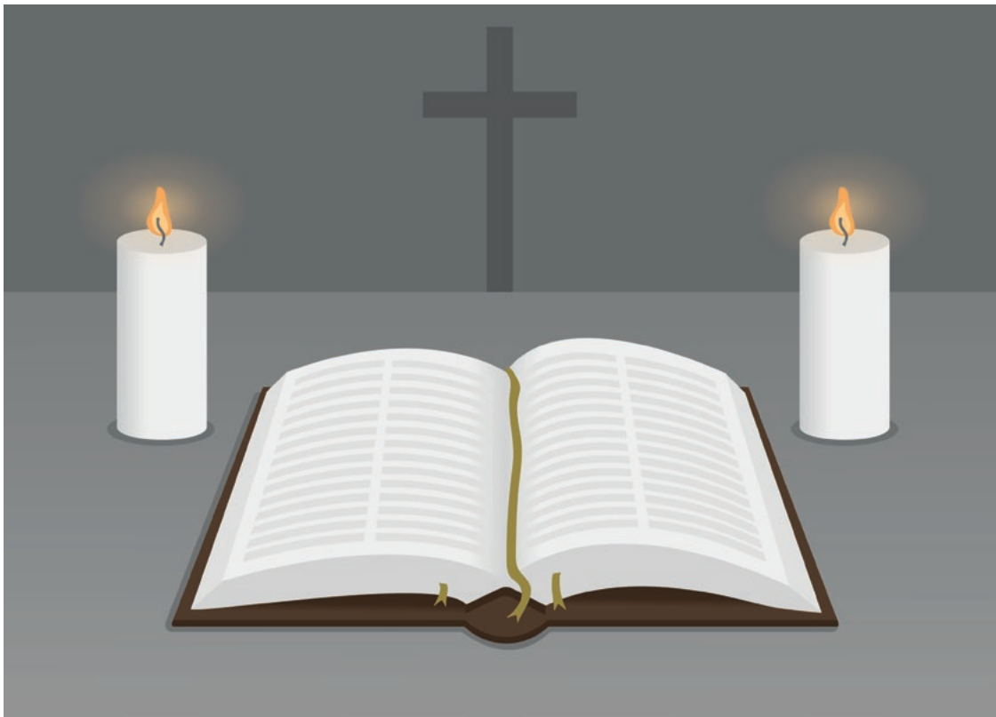
Uskon ytimessä Jumalan sana ja rukous. (CS)