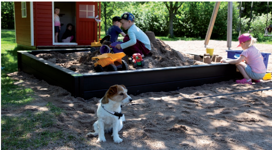
Järvelän seurakunta-keskuksen pihassa päiväkerholaisia. (JJ)

Sunnuntaipyhäkoulusta siirryttiin ensimmäisen vuosikymmenen aikana arkipyhäkouluun kerhoissa, päiväkodissa ja perhekerhossa. Päiväkodin väki on adventtina ja pääsiäisenä kokoontunut seurakuntakeskukseen yhteiseen kirkkohetkeen.