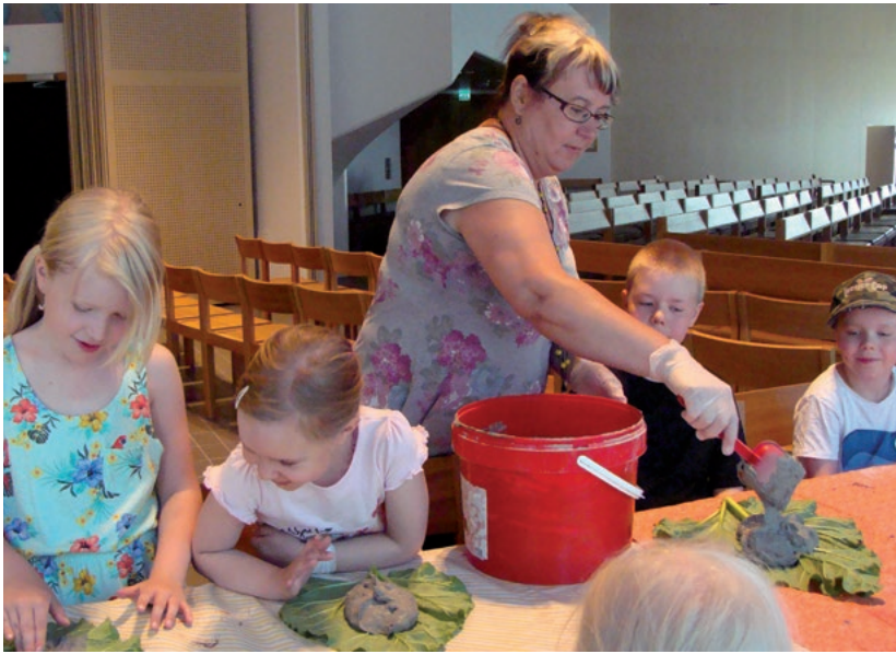
Sovituksenkirkon kesäkerhon puuhasteluja vuodelta 2010. (JS)

keskukseen, joka on tarjonnut monipuoliset puitteet. Yöleirit ja päiväretkitoiminta keskittyivät syys- ja hiihto- ja pääsiäislomajaksoille. Samalla leirit ovat rippileirejä myöten hieman aiemmasta lyhentyneet. Vuonna 2021 rippikoululeiri kesti seitsemän päivää. Vuosituhannen alussa leirit olivat kolme päivää pidempiä, mutta sittemmin osa leirin ohjelmasta on päädytty eri syistä jakamaan leiriä edeltävän talven viikonlopuille.