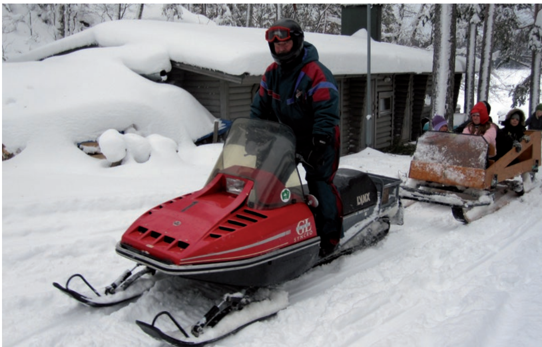
Särsjärven laskiaistapahtumassa oli hyvät mahdollisuudet pulkkamäkeen ja moottorikelkkailuun.

kortit 1–3-vuotiaille ja vieraili miltei jokaisen 4-vuotiaan kotona 2000–2012. Pyhäkouluja pidettiin vapaaehtoisvoimin seurakuntakodilla tai kirkossa, eri kylissä ja esikois-lestadiolaisten rukoushuoneella. Osallistujia oli viikoittain 60, suurin osa torstai-iltaisina ”ruksalla”. Kirkonkellarin pyhäkoulu loppui vesivahingon ja sisäilmaongelmien vuoksi vuonna 2013. Pappi vieraili muutaman kerran vuodessa Majavan päiväkodissa ja Pikkumajavassa vuoteen 2016 asti sekä järjesti joulun ja pääsiäiskirkon. Jouluvaellukset olivat pienille mielenkiintoisia, kun paikalla oli joskus niin elävä aasi, lampaista kuin kanojakin.