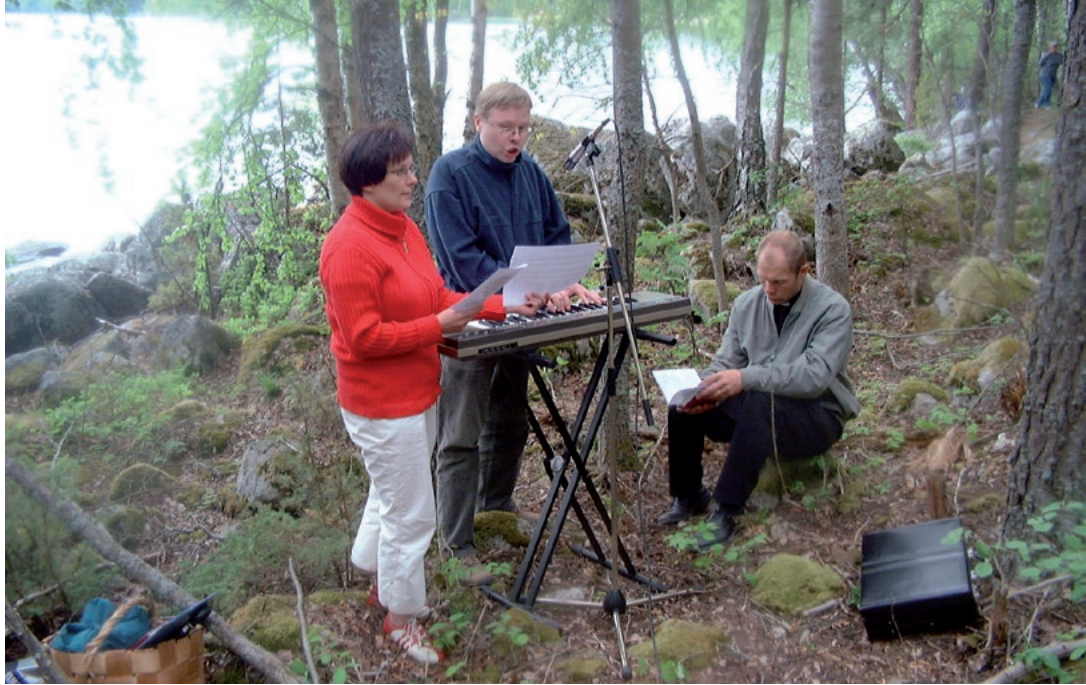
Padasjoen kirkkokuoro toimi 1956–2021. (PS)