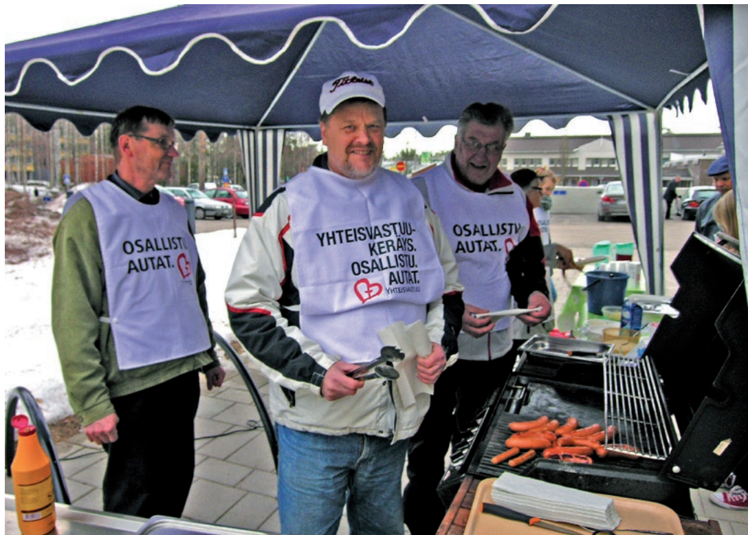
Yhteisvastuukeräystä avusti myös vuonna 2011 kymmenittäin vapaaehtoistyöntekijöitä, kuten kuvan makkaranmyyjät Sovituksenkirkolla. (15)

Yleisesti ottaen nykyisen kantaseurakunnan seurakunnallinen toiminta oli keskittynyt jo 1980–90-lukujen aikana kahdentoistatu-