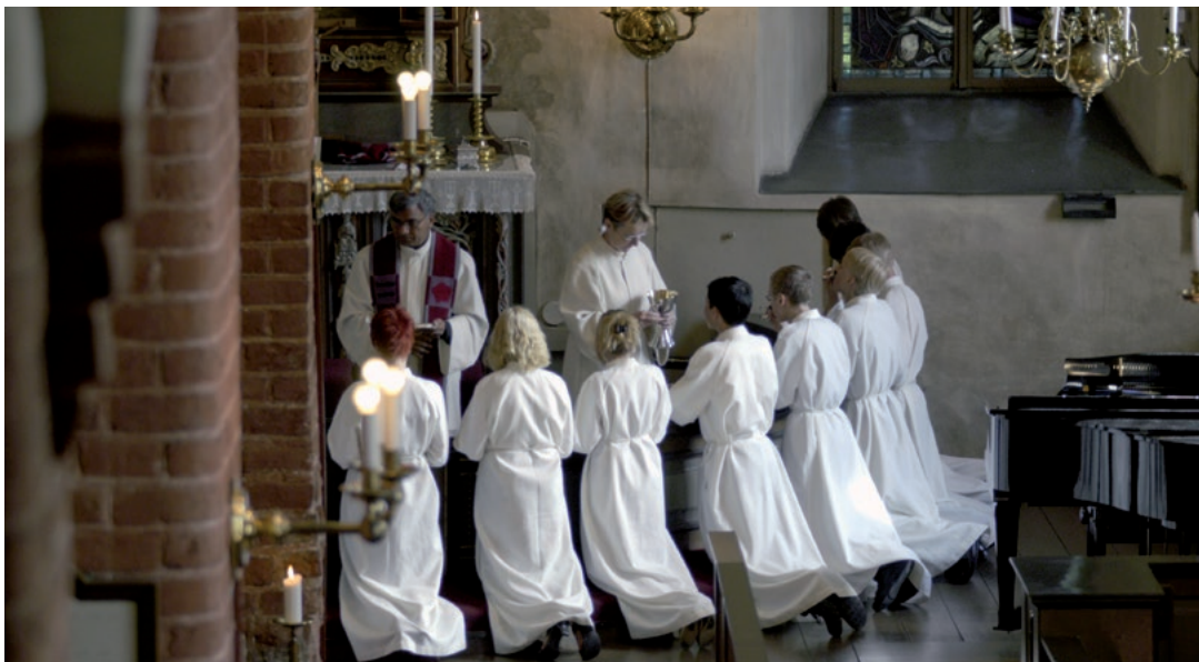
(HOL 6 Rippikoululeirit ovat pysyneet suosittuina koko 2000-luvun ajan. Hollolassa konfirmaatiot pidetään tavallisesti keskiaikaisessa kirkossa.)