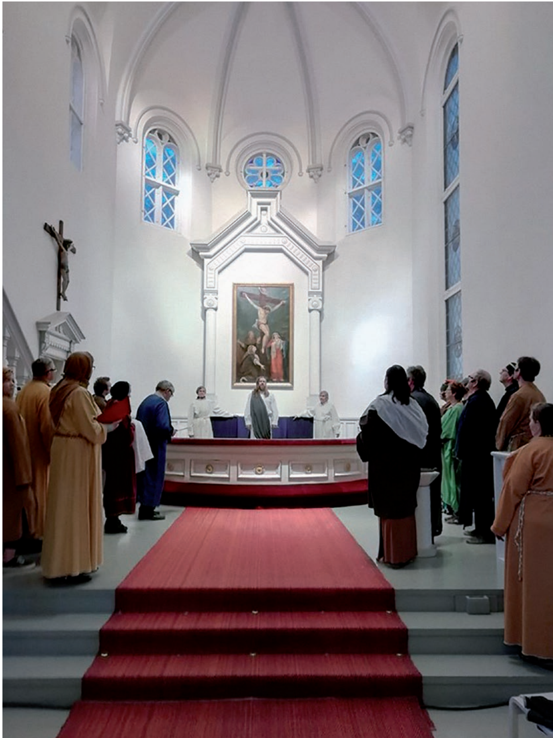
Pääsiäisenä 2019 kärköläläiset toteuttivat pääsiäisnäytelmän "Ylösousemus". Näytelmä kokosi yhteen 26 näyttelijää ja 20 hengen kuoron. (K-MT)