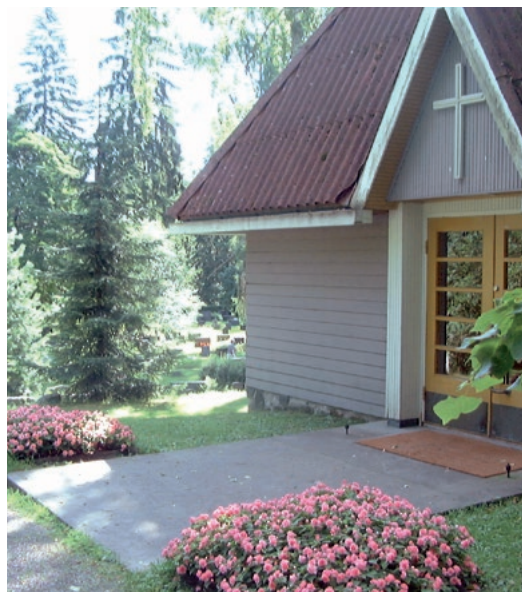
Padasjoen siunauskappeli. (PS)

Metsää Padasjoen seurakunnalla oli 400 hehtaaria. Sitä hoidettiin metsänhoitoyhdistyksen metsätaloussuunnitelman mukaisesti. Vuonna 2002 seurakunta luovutti Metsähallitukselle Virmailan saaresta Pitkäniemen