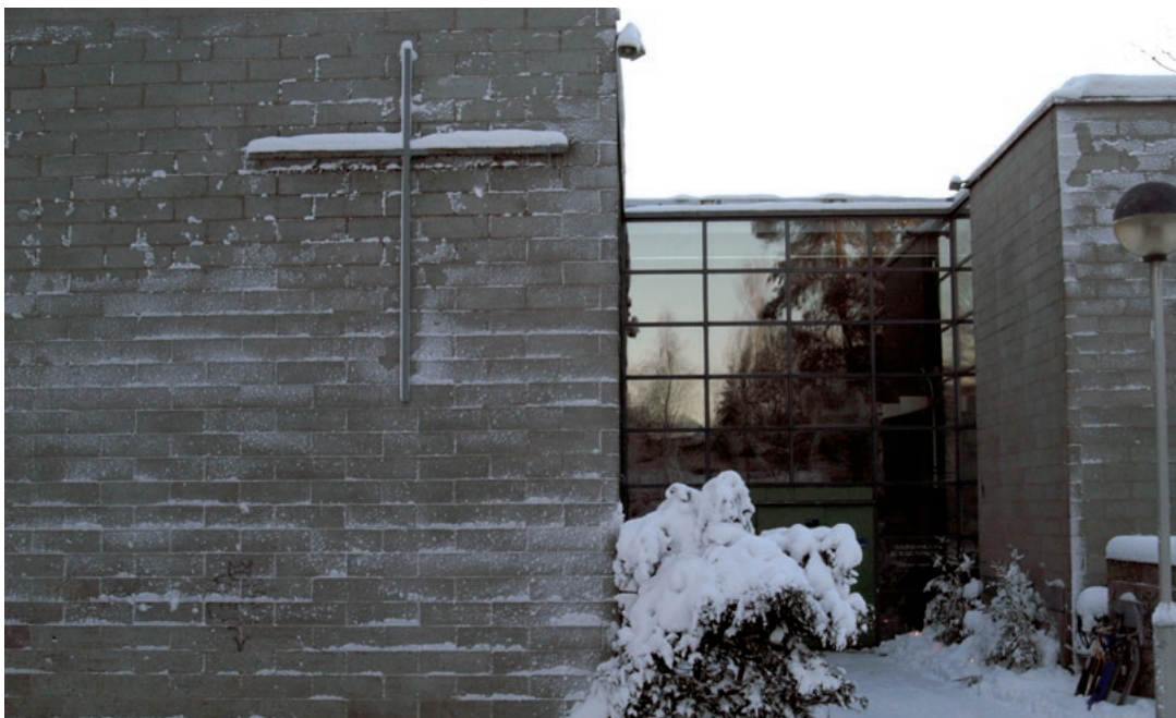
Monille jäi lämpimiä muistoja myös Salpakankaan vanhasta seurakuntakeskuksesta, joka purettiin vuonna 2011.