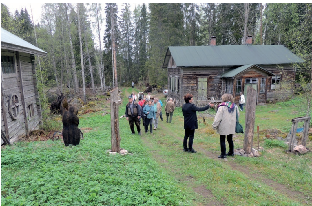
Pekka Halosen Kivikosken kesäasunto oikealla, vasemmallä vesimylly.

vuoren mysteeri. Linnavuorella seurakunta järjesti metsäkirkkoja.