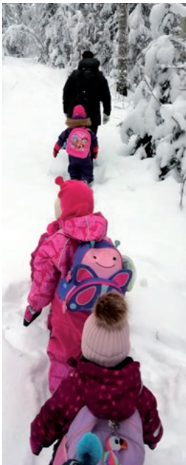
Päiväkerholaisia menossa metsäretkelle talviselle Linnakalliolle. (EA-H)

ja kesäasukkaiden sekä veteraanien kirkkopyhät. Joka kesä toimitetaan myös luomakunnan jumalanpalvelus rauniokirkolla. Se pidettiin ensimmäisen kerran vuonna 1996.