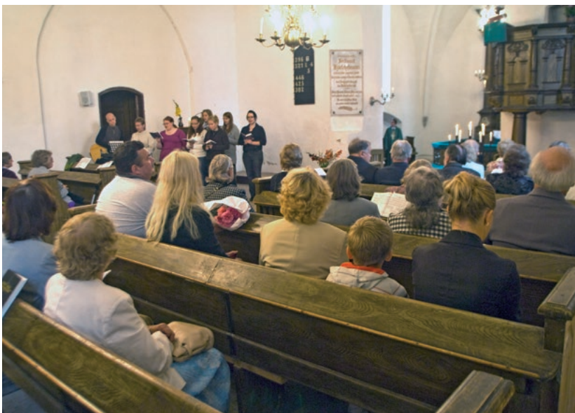
Hollolalaisia Kosen kirkossa vuonna 2008. (JV)

Toiminta on ollut isolta osaltaan seurakuntalaisten, musiikkiryhmien ja työntekijöiden vierailuja sekä vuosien varrella syntyneitä ystävyyssuhteita. Merkittävää lähes tyhjästä aloittaneen Kosen seurakunnan tukemisessa on ollut lahjoitustavaroiden kuljettaminen koselaisten kirpputorille. Kirpputorin tuotolla on kustannettu valtaosa seurakunnan toiminnasta ja papin palkasta.