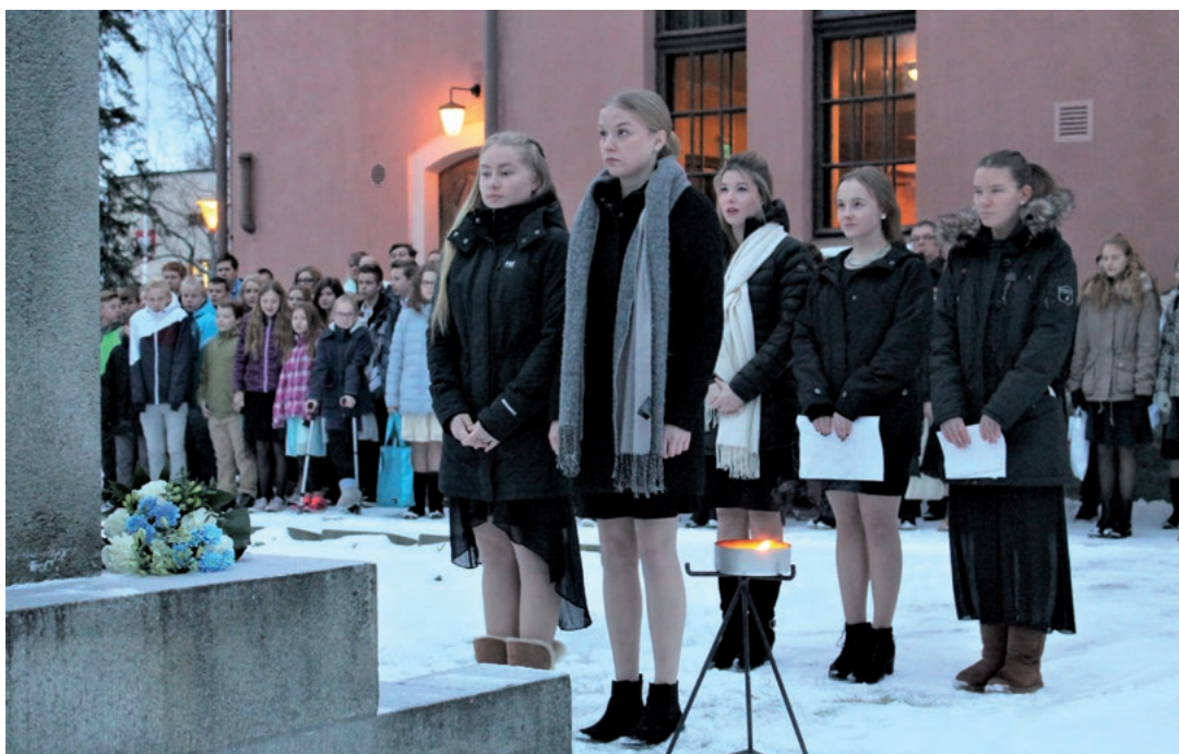
Suomen 100-vuotisjuhlallisuuudet sankarihaudoilla 2018 (PS)