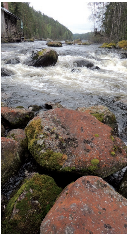
Kivikosken ryöppyä yläjuoksulla.