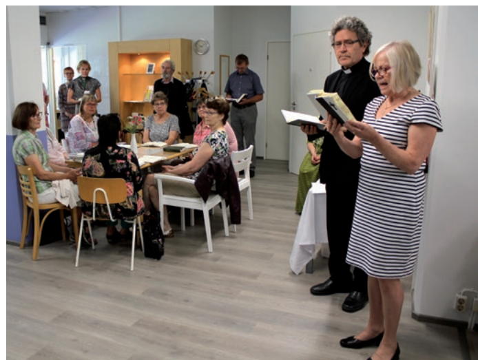
Missiokammarin uudistuneiden tilojen avajaisia vietettiin elokuussa 2017. (JS)

Lähetysaktiivit käynnistivät Missiokaupan toiminnan vuonna 1990. Sen ensimmäinen toimipiste oli silloisen seurakuntakeskuksen viereisessä vanhassa pesulatalossa. Tilat olivat