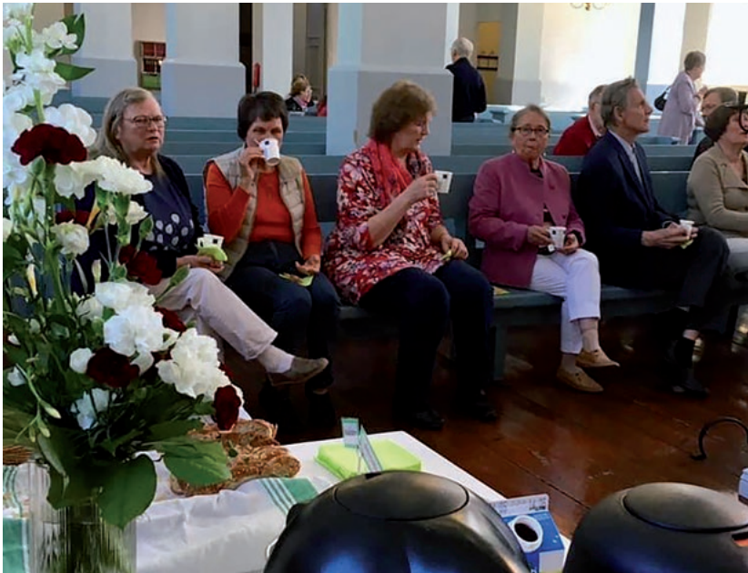
Seurakuntalaisia kirkossa kahvilla jumalanpalveluksen jälkeen. (JH)