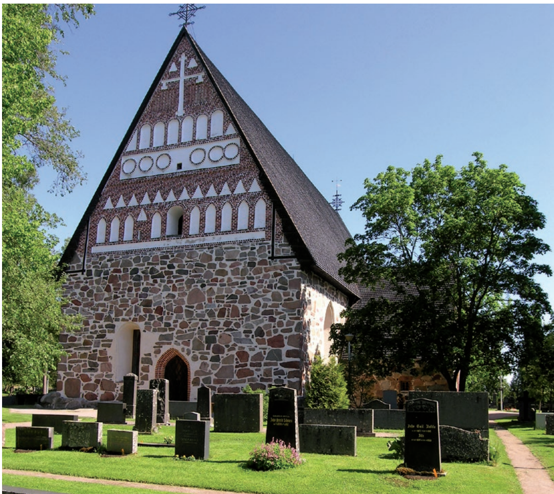
Hollolan kirkko on maamme vaikuttavimpia keskiaikaisia rakennuksia.