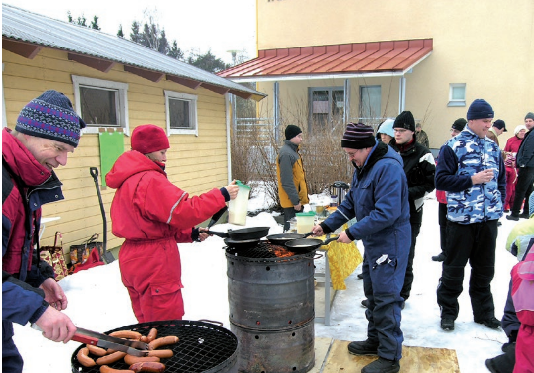
Paimelan talvitapahtumaa on vietetty 1970-luvulta alkaen. Makkaramyyntipiste vuonna 2008. (JV)

epäkäytännölliset, joten seurakunta vuokrasi 90-luvun lamassa vapautunutta liiketilaa Kauppakujalta sekä Missiokaupalle että diakonian lähimmäispalvelupiste Kaiken kansan kammarille. Kammari vakiinnutti pian voittoa tavoittelemattoman kahvila- ja lähimmäispalvelutoimintansa ja Missiokauppa taas asemansa laadukkaana lahjavarakauppana sekä tärkeänä lähetystyön tuki- ja infopisteenä.