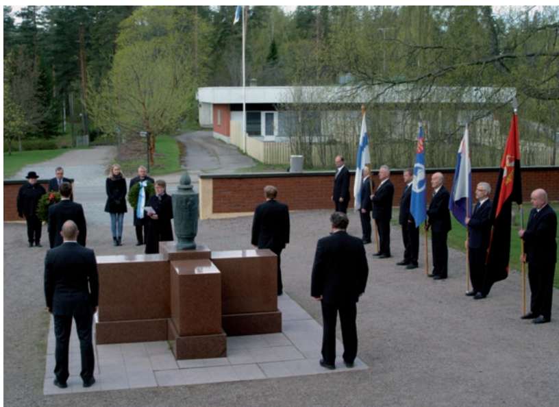
Kaatuneiden muistopäivän juhlallisuudet sankarihaudoilla. (JJ)

Kirkkokuoro kanttorin johtamana on kantanut vastuuta juhlapäivien messuista. Vuonna 2022 kuoro juhli 100-vuotista taivaltaan. Laulajia on vuosien varrella ollut 15–26. Kirkkokuoro on koonnut aikuisia laulajia yhteen, mutta uusien kanttorien myötä syntyi