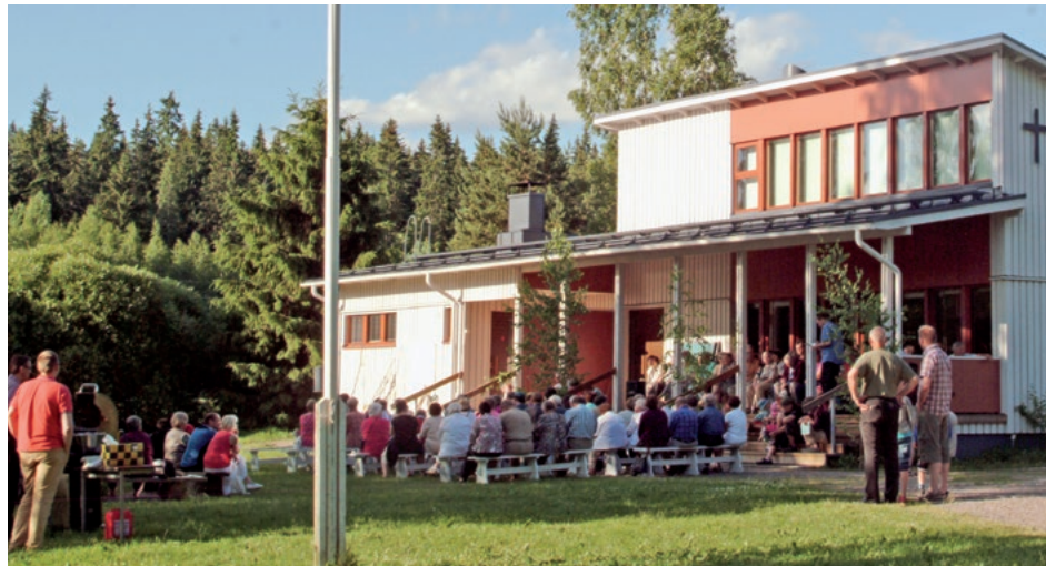
Kalliopirtin juhannusjuhla. Juhannuskokon äärelle on kokoontunut ihmisiä kaikista ikäluokista yli seurakunta- ja pitäjärajojen. (JJ)