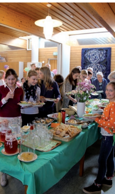
Kesän korvalla seurakuntakodilla juhlittiin vappua vapaaehtoisten järjestämällä vappubrunssilla.