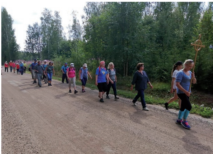
Laurinvaellus etenee ristikulkuena. Ensimmäinen vaeltaja on aina ristin kantaja, ja muut seuraavat joukkona perässä.

Toimintaa pyörittää runsaan 20 vapaaehtoisen seurakuntalaisen rinki. Tarjolla on aina kahvia, leivonnaisia tai keittoa, kaikki vapaaehtoisista maksua vastaan. Myytävänä on erilaisia vapaaehtoisten tekemiä tuotteita, kuten neu-leita, villasukkia, huiveja, koriste-esineitä sekä leivonnaisia. Vappuna voi ostaa simaa, munkkeja tai tippaleipiä. Jouluna on tarjolla pipareita ja kakkuja sekä joulukoristeita. Myyntituotot ja kahvikolehti menevät Etelä-Virossa olevan ystävyysseurakunta Karulan työn tukemiseen, muuhun lähetystyöhön tai yhteisvastuukeräykseen antajan päätöksen mukaan. Ystävänkulmassa järjestetään erilaisia teemapäiviä tai -viikkoja, ja siellä kokoontuvat seurakuntapiirit ja lauluryhmät. Toiminnan organisoinnista vastaa diakoniatyö.