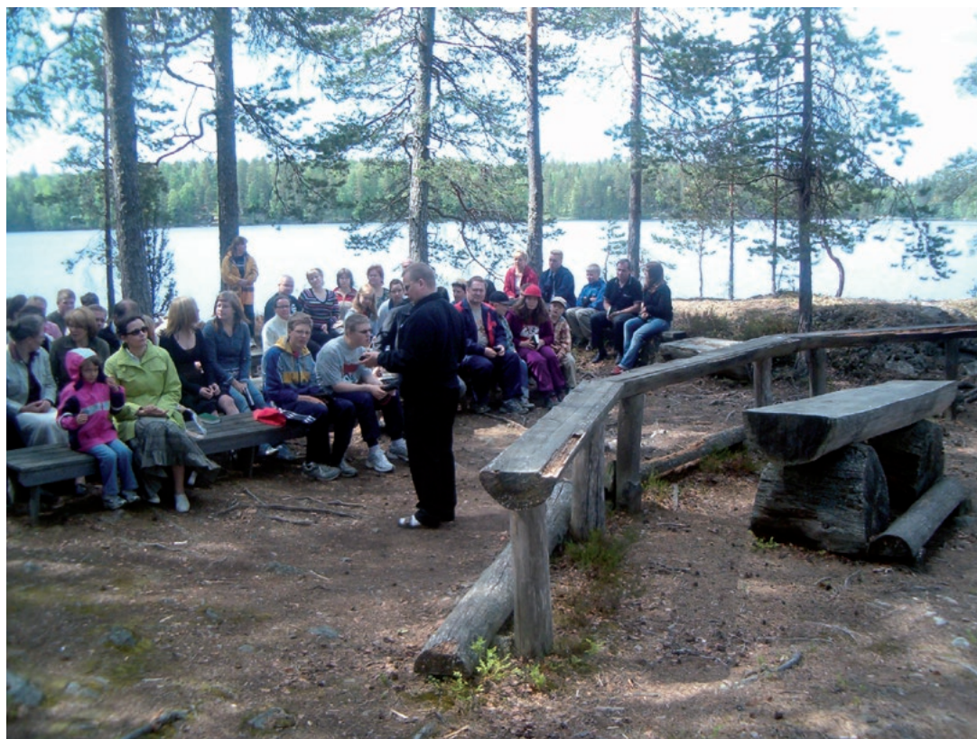
Särsjärven leirikeskuksen leirikirkko sijoitettiin keskelle kauneinta Särsjärven rantaa. (SRK)

Padasjoen Särsjärven leirikeskus ja ranta-sauna Särsjärven maisemissa Taulun risteyksestä Auttoisille päin oli valmistumisestaan 1985 asti runsaassa käytössä. Leirejä ja muita tilaisuuksia oli viikoittain. Seurakunnan omat käyttöpäivät vähenivät 2000-luvulla, ja tilaa vuokrattiin myös muiden seurakuntien rippileirikäyttöön. Hollolaan yhdistymisen