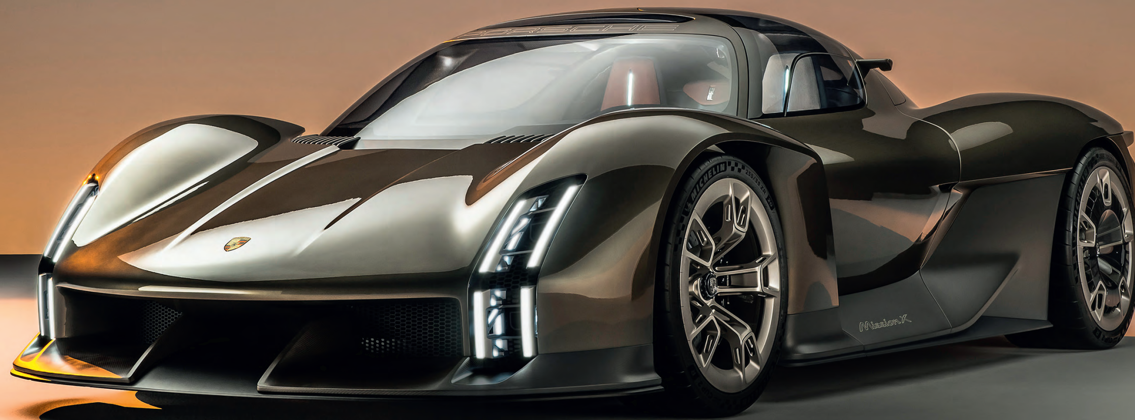
↳ Porsche Mission X (2023).

– Ikoninen autolegenda juhlii merkkivuottaan