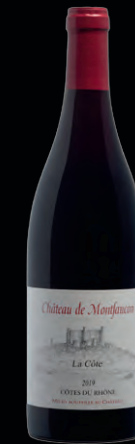
Château de Montfaucon La Côte Côtes-du-Rhône 2019