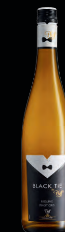
Pfaff Black Tie 2021