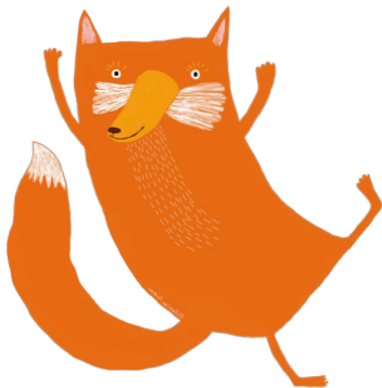
Kuvitus: Karoliina Pertamina