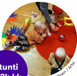
Eva Hyttönen / Artsi

Artsin Värikkäitä ääniä -työpajassa lapsi tutustuu väreihin oman aikuisen kanssa leikkien ja tutkien. Paja sopii 5-24 kuukauden ikäiselle vauvalle tai taaperolle yhdessä aikuisen kanssa. Sisaruspajoihin voi osallistua myös vanhempi sisarus. Sopii myös erityislapsille. Pajan ohjauskieli on suomi.