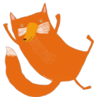
Kuvitus: Karoliina Pertamina

Play, sing, play music and dance together with Kukkuu! -the fox and his friends. The video is suitable for people of all languages and can be found on the Vantaa City Library's YouTube channel. The show toured libraries in 2022 during Kukkuu art festival.