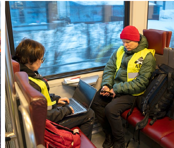
↑ Lakkotapahtumien raportointi mediassa ja somessa on osa vaikuttamista.

jo kaavailtuja sortotoimia peruttiin. Maahan saatiin myös yleinen ja yhtäläinen äänioikeus sekä yksikamarinen eduskunta.