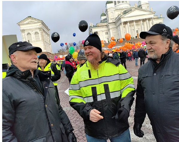
↑ AKT osallistui helmikuun alussa Senaatintorin tapahtumiin ja lakkoon. Linja-autonkuljettajat olivat töissä, jotta väki pääsi osoittamaan mieltään.