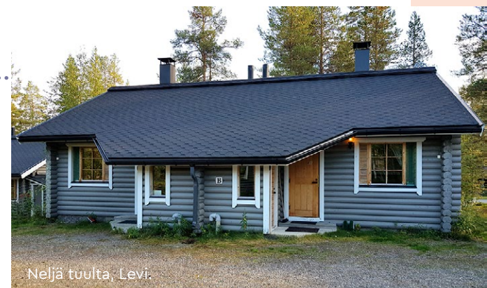
Neljä tuulta, Levi.

Semesterplatser hyrs ut bara till AKT:s medlemmar och de får inte ges vidare till utomstående.