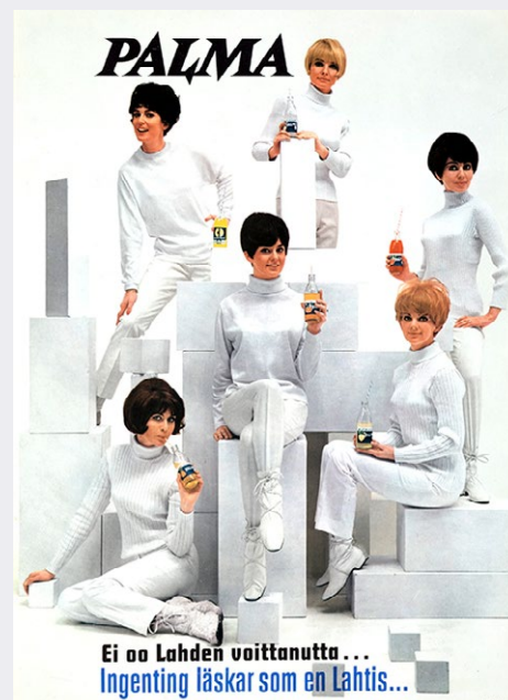
Mallasjuoman juliste. Suunnittelija tuntematon, 1960-luku. King Cola.

Museo sijaitsee entisessä Mallasjuoman panimorakennuksessa. Sieltä löytyy lisäksi vaihtuvia näyttelyitä, jotka keskittyvät nykyaiteeseen. Itse rakennus ja kokonaisuus ovat tutustumisen arvoisia, vaikka ei suuri taiteen ystävä olisikaan. Talosta löytyy myös ravintola, paikallinen pienpanimo ja pub. Näyttelyyn ehtii tutustumaan vielä 29.4.2024 asti. ●