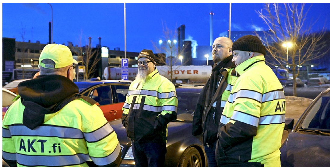
↑ AKT:n toimitsijat olivat Vuosaaren satamassa lakkojen alkaessa jo aamutuimaan lakkovahtien tukena.

Lakkoja seurataan tiiviisti AKT:n nettisivuilla akt.fi/uutiset sekä verkkolehdestä aktlehti.fi ja myös sosiaalisessa mediassa Facebookissa sivulla AKT Liitto ja Instagramissa AKT Liitto. ●