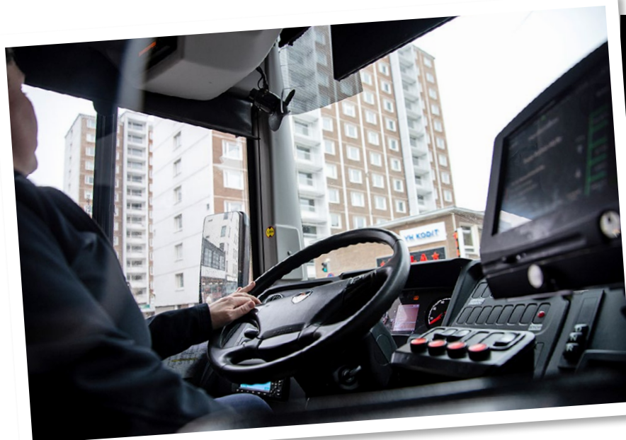
↑ Linja-autot ovat Taijan Niemen uran aikana modernisoituneet melkoisesti.

Naiskuljettajien prosentuaalinen osuus on edelleen aika pieni.