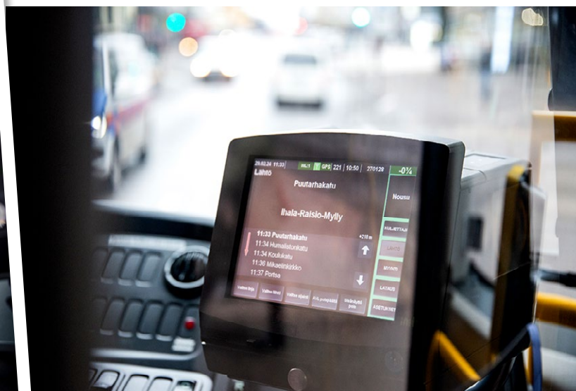
↑ Ajosarja voi olla päivittäin erilainen. Välillä vaihdetaan linjaa ja välillä jopa autoa.