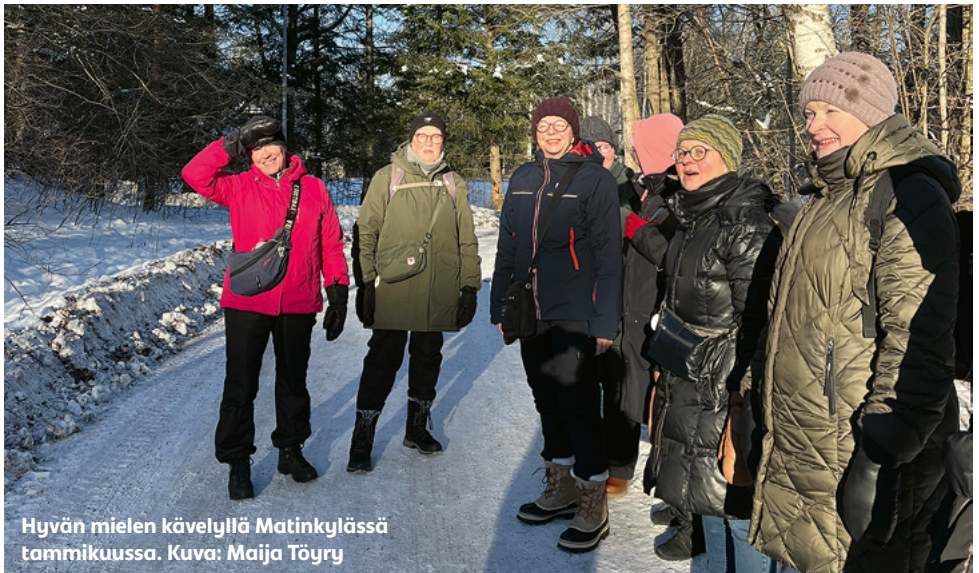
Hyvän mielen kävelyllä Matinkylässä tammikuussa.

Espoon Latu ja Polun pidempien kävelylenkkien viimeinen lenkki. Nyt kävellään ja nautitaan nuotiosta!