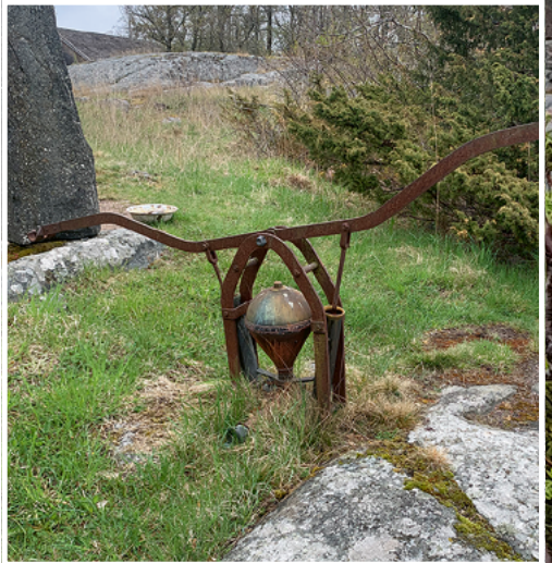
Hylkeenpyytäjän asuinsija ja kaivo.