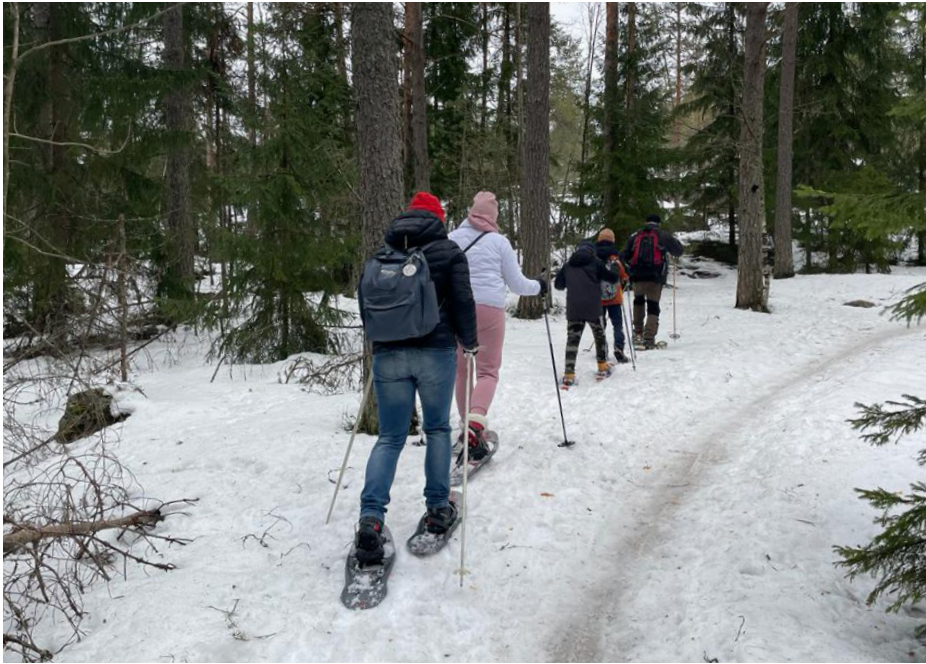
Ukrainalaisia testaamassa lumikenkiä