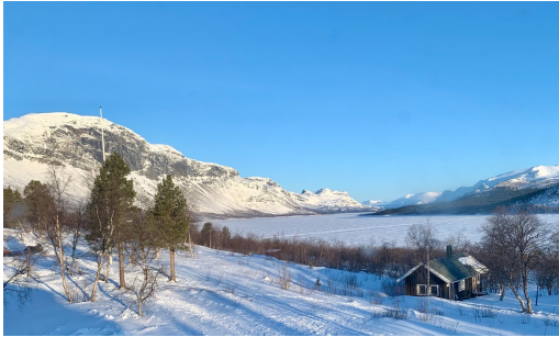
Näkymä makuuhuoneemme ikkunasta Saltoluoktan tunturiasemalla.