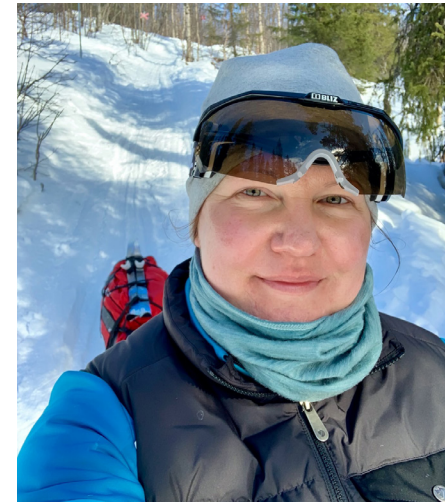
Kun on tarpeeksi hulluna hiihtämiseen, hymyilyttää vaikka kuinka voimat olisivat lopussa. Kuvassa jutun kirjoittaja ahkioineen päivineen

Vuoristotuvissa on sekä yhteiset tilat että erilliset makuuhuoneet. Yhteisessä tilassa on keittonurkkaus, tiskipesupiste, ruokailupöytiä ja kamina. Keittiön varustukseen kuuluu monipuoliset keittotäydennykset ja ruokailuvälineet, joten aamukahvin saattaa juoda posliinikupista. Vesi kuljetetaan tupaan purosta tai järvestä 20 litran muoviasialla, joka talviolosuhteissa toimii kätevästi narun perässä liukkaasti kulkevana kelkkana. Puu- ja kaasuhuolto toimii kotoisissa autiotuvissamme. Joissain vuoristotuvissa on lisäksi kuivaushuone ja erioi aamupesua varten. Makuusijan saattaa varata etukäteen mutta tupaan voi saapua myös ilman varausta. Makuuhuoneissa on kerrossängyt ja niihin mahtuu nukkumaan paikan mukaan 2–6 henkeä huonetta kohden. Jos kerrossängyt ovat täysiä, otetaan kerrossängyjen alta löytyvät vieraspatjat käyttöön. Kerrossängyissä on valmiiksi patjat, tyynyt ja peitot. Omat liinavaatteet tai makuupussi ovat tarpeen.