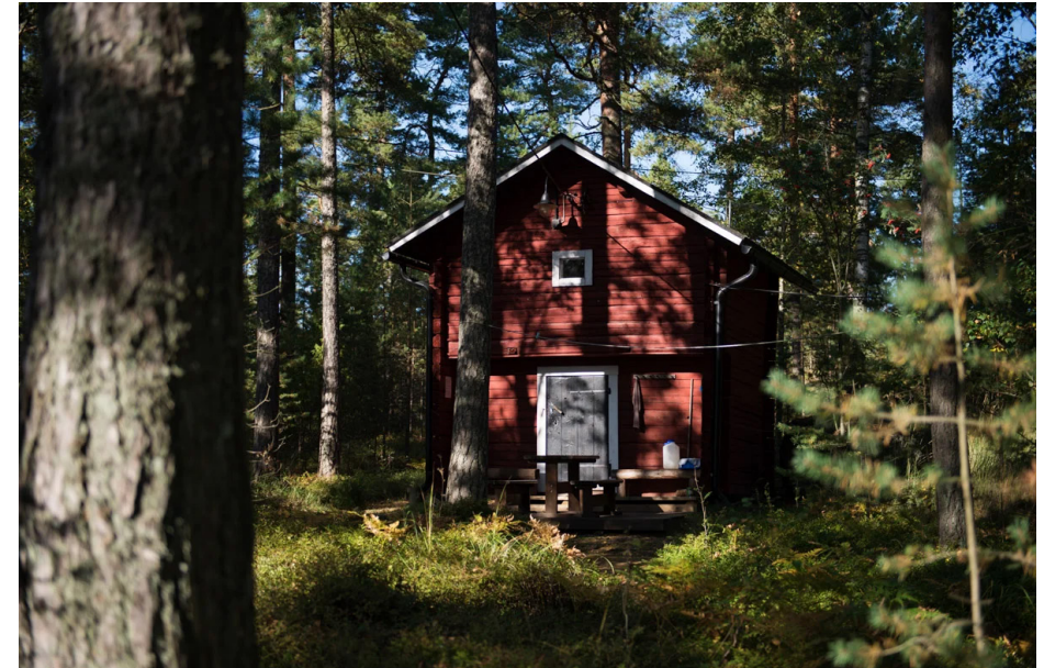
Vuokrattava tupa Gölisnäsissä

Örön linnakesaari on keväisen saariretkemme kohde huhtikuussa parhaaseen lintujen muuton aikaan. Saari on mainio luontoretkikohde ja samalla näkyä vielä äsken aktiivisessa käytössä olevaan rannikopuolustuksen historiaan. Saarella on kattavat majoitus- ja ruokailupalvelut käytössä ympäri vuoden.