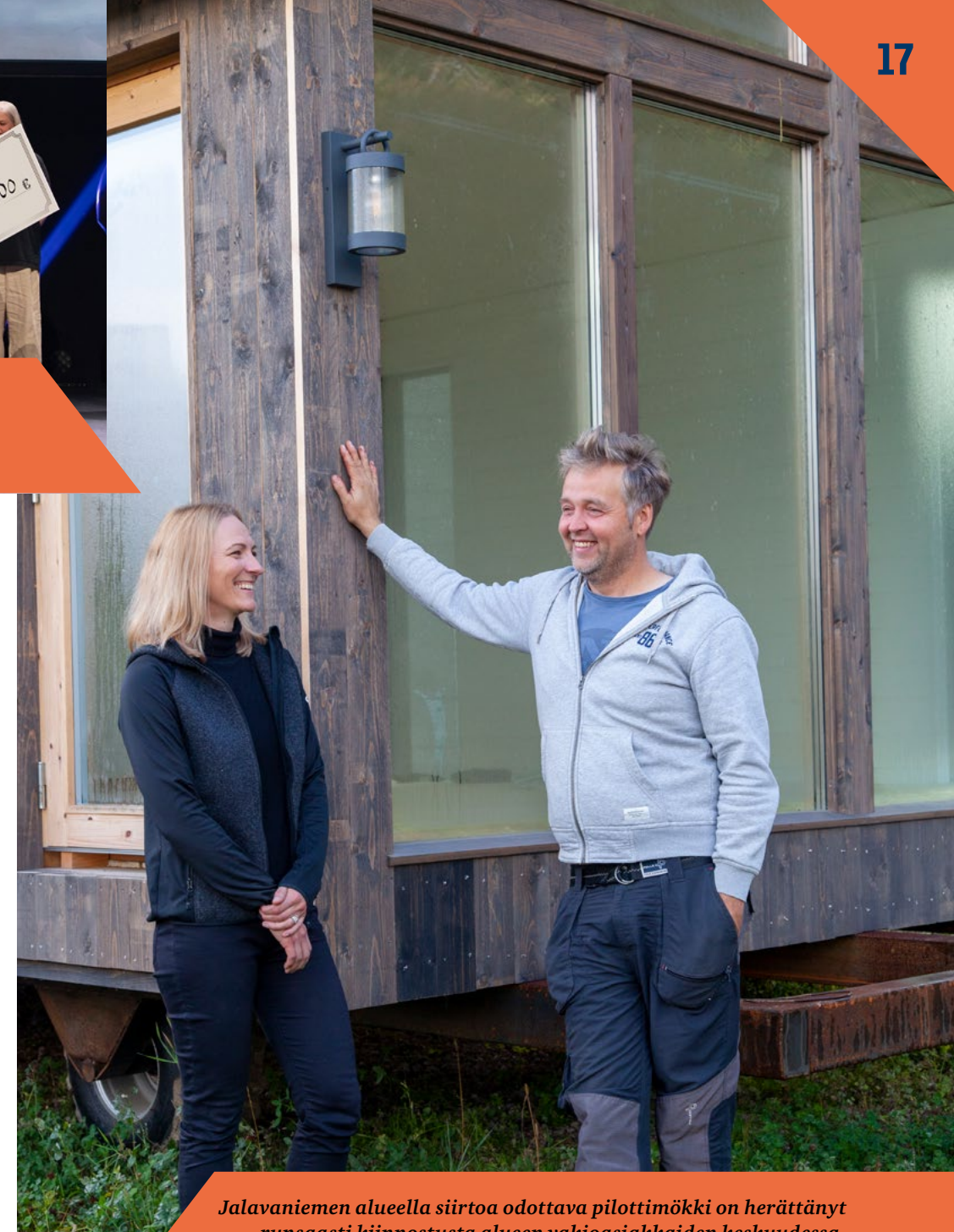
Jalavaniemen alueella siirtoa odottava pilottimökki on herättänyt runsaasti kiinnostusta alueen vakioasiakkaiden keskuudessa.

– Meillä on hyvä, vakiintunut tilanne. Asiakaspaikoistamme valtaosa on kausipaikko-