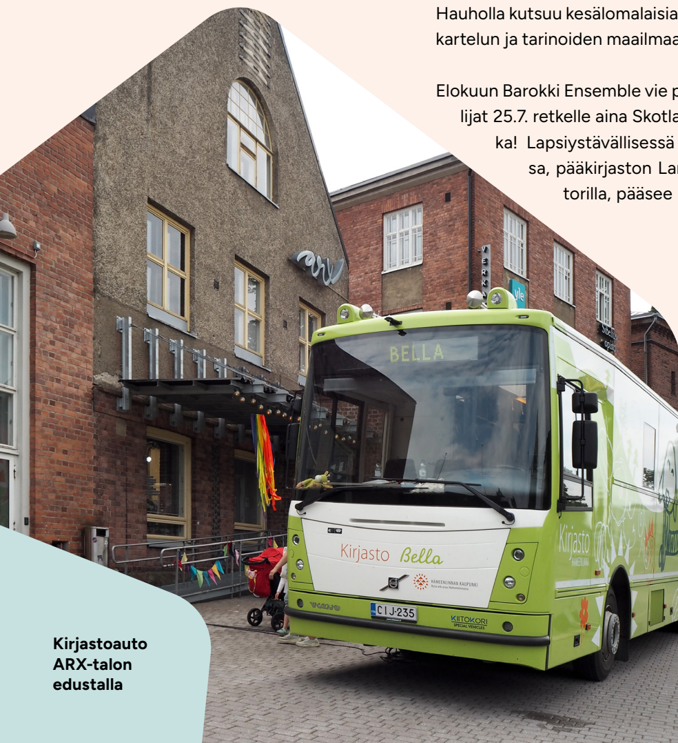
Kirjastoauto ARX-talon edustalla

Ilmoita vieraslajihavainnoista: vieraslajit.fi .