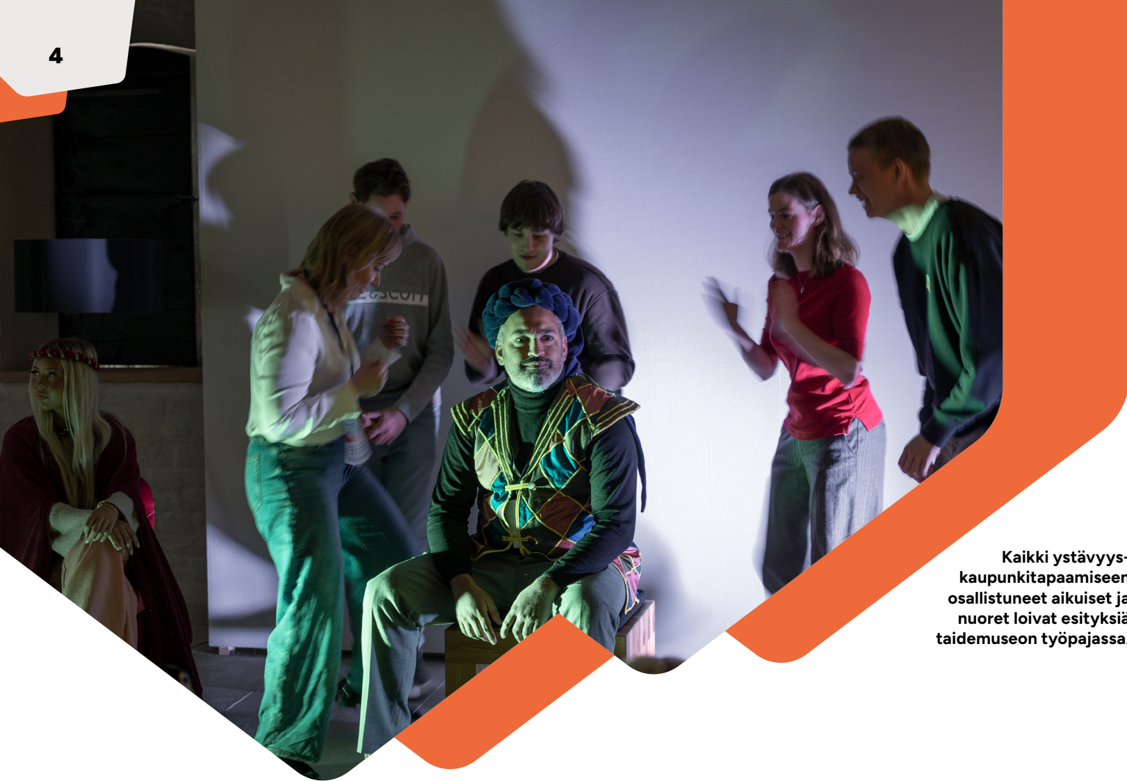
Kaikki ystävyyskaupunkitapaamiseen osallistuneet aikuiset ja nuoret loivat esityksiä taidemuseon työpajassa.