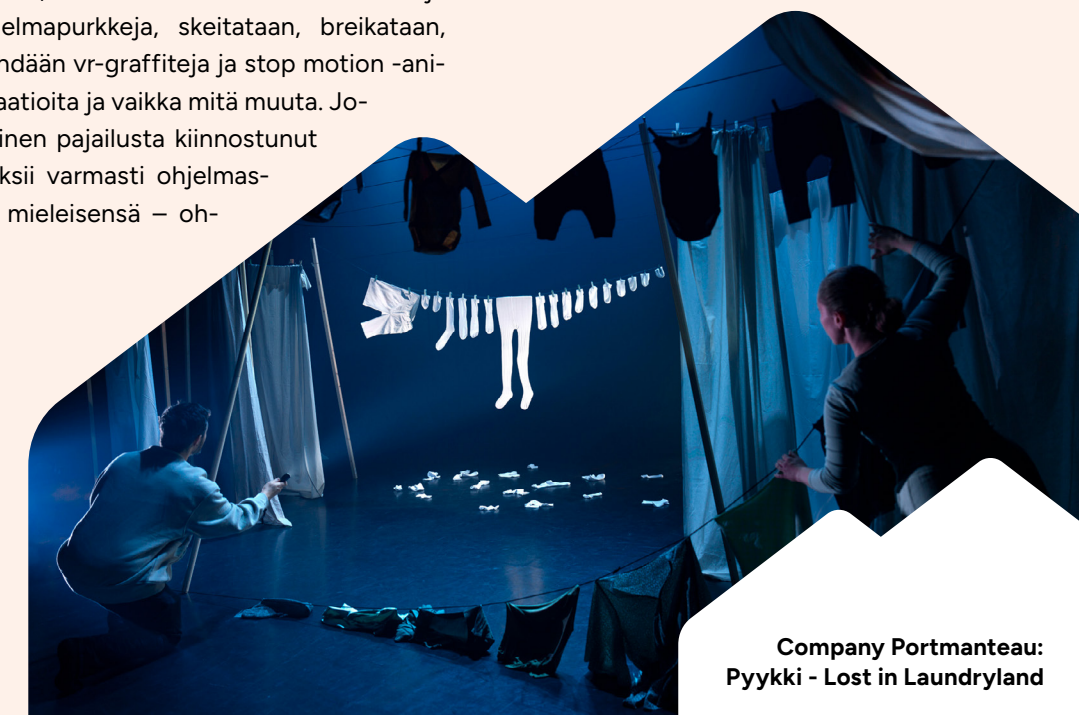
Company Portmanteau: Pyykki - Lost in Laundryland

Seuraa somessa Hippalot-uitisia facebook.com/hippalot @instagram.com/hippalot