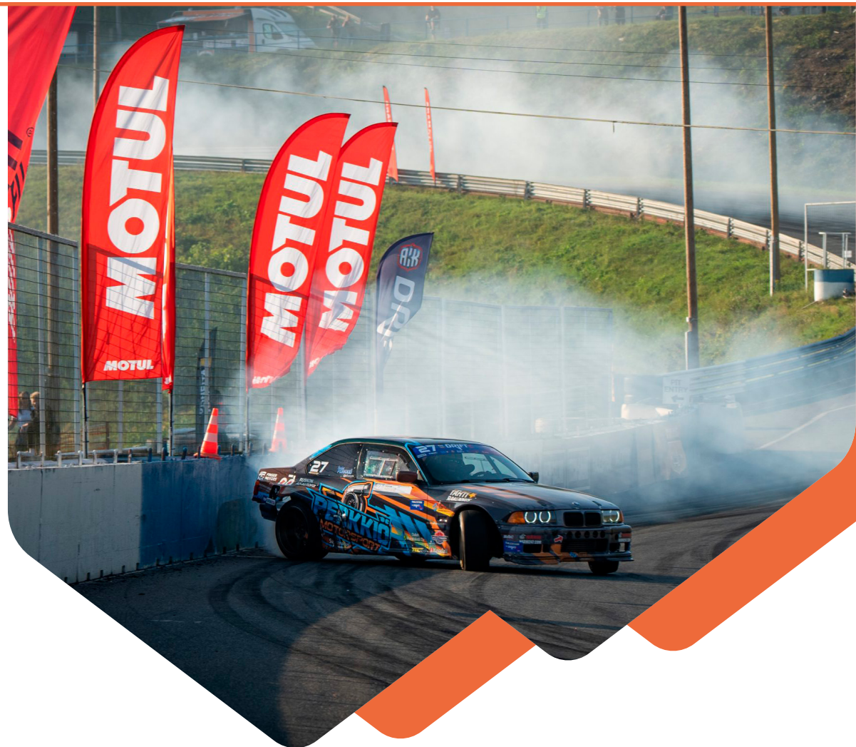
Drift Masters Ahvenisto