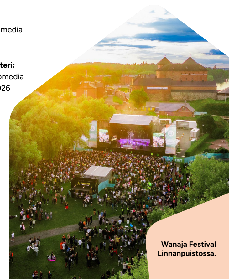
Wanaja Festival Linnanpuistossa.

Katso kaikki Hämeenlinnan kesän suurimmat tapahtumat: www.hameenlinna.fi/tapahtumat