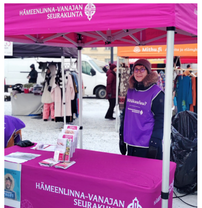
Seurakunnan löydät myös markkinoilta!

Helmitempauksessa markkinoilla kerättiin lahjoituksia ja keskusteltiin köyhyydestä ja