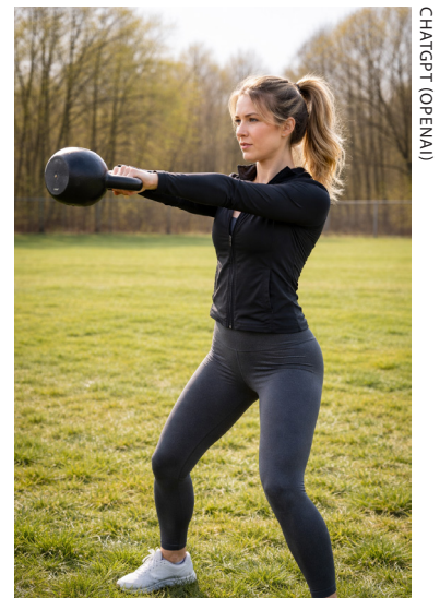
Toukokuussa treenataan liikunnallisilla pop up -pisteillä.

Liikuntapäivä 9.5. Saaren seurat, yritykset ja yhdistykset järjestävät liikunnallisia pop up -tapahtumia ympäri saarta. Lauttasaari-Seura järjestää.