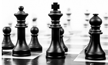
Shakki on pelien kuningas ja kuningatar.

KIRJASTO Pajalabdentie 10 a Shakkikerho maanantaisin kello 17–20.