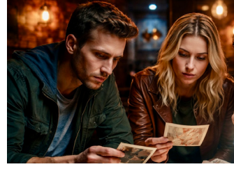
Uhri tiedetään, mutta tekijä on tuntematon.

Arkiviikolla Lauttasaareissa voi ratkoa murhia ja mitellä yleistiedolla. Murhamysteeriä ratkotaan torstaisin kello 18 Bar Sidewalkissa, Lauttasaarentie 25. Baaripähkinöitä purtavaksi tarjoaa ravintola Kaunis Kampela (Lauttasaarentie 10) tiistaisin klo 18.