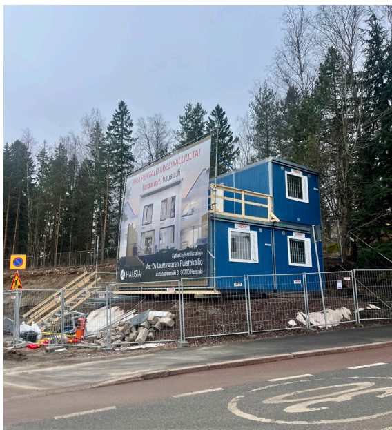
Työt käynnistyneet Lauttasaarenmäellä.