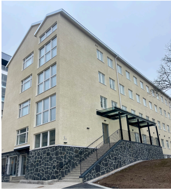
Uuden karheaa tarjolla Särkiniementiellä.

”Lauttasaarissa on kaiken kokoisia asuntoja myynnissä paljon.