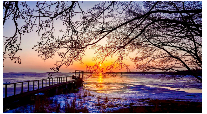
Jäitä piteli, kunnes ei enää. Jari Neuvosen hieno maaliskuinen laukaus länteen.