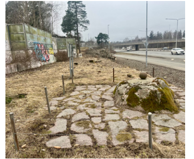
Tuntemattoman sotilaan haudan ympäristössä on nyt väljä. Haudalle on käynti portista Pohjoiskaaren puolelta.

Hoitorakasta on vastannut YIT Road Oy. Tilajana toimii Kaakkois-Suomen elinvoimakeskus. 🇫🇮