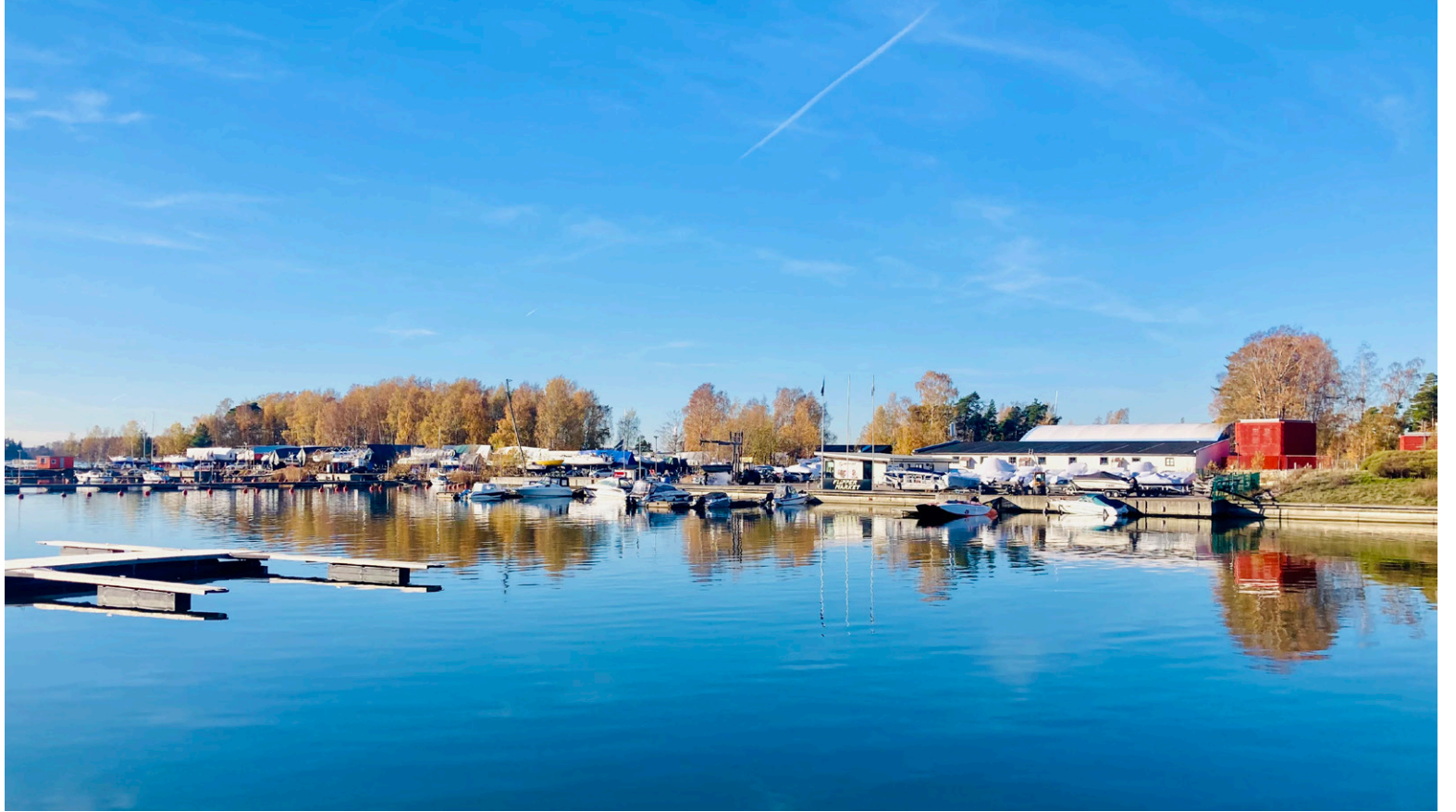
Koivusaaren tulevaisuus on yhä avoin.

Koivusaaren noin hehtaarin laajuisella kierrätyskentällä olisi väliavarastoitu ja käsitelty stabiloimalla sellaisia pilaantuneita ruoppaus-