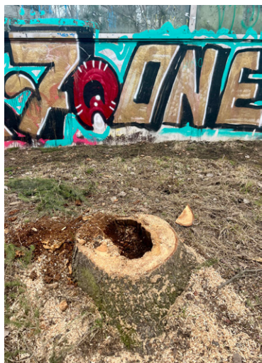
Monissa puissa näkyy lahovaurioita.

”Kyse on maanteiden eritasoliittymien viheralueiden hoidosta, jota tehdään valtakunnallisesti ympäri Suomea. Näkyvimmat toimenpiteet