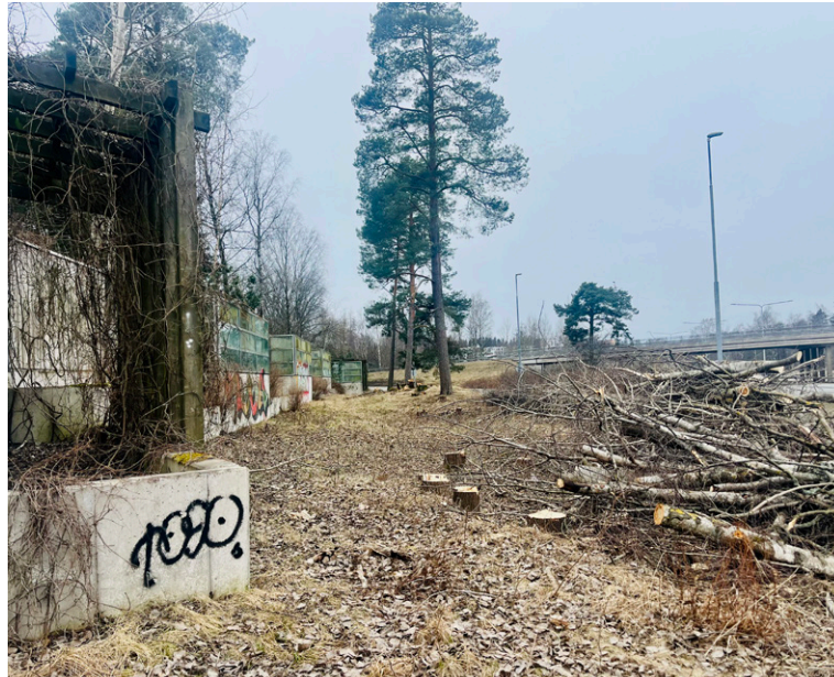
Meluseinän ja Länsiväylän väliltä on kaadettu kymmeniä puita.

ajoituvat pääosin vuoteen 2024, jolloin Lauttasaarssakin Lemissaaren eritasoliittymän metsittyneitä alueita harvennettiin, parannettiin rampien näkemiä ja vapaata liikennetilaa. Toimenpiteet tuolloin ja nyt olivat osa ympärivuotista kunnossapitoa.”