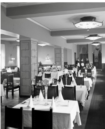
Ei sentään Rixi, mutta sen tarinaan liittyvä art deco -vaikutteita omannut ravintola Franciskanerin Punavuorella 1920-luvulla.

Roslundit ostivat Pohjoiskaari 39:stä suuren kaksikerroksinen hirsihuvilan, josta oli upeat näkymät Hietaniemeen ja Seurasaareselälle. Naapurina asui Karhumäen perhe. Heidän rannassaan oli veljesten ja talossa asuneiden lentäjien vesitasokoneita. Hirsihuvilasta (myöhemmin Pohjoiskaari 35) tuli suvun kesäpaikka, joka purettiin 1960-luvulla, kuten monet muutkin ranta-alueen talot, kun Lapinlahden moottoritien rakentaminen alkoi.