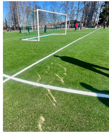
Maissikentällä on työkoneneen jälkiä huoltotoista.