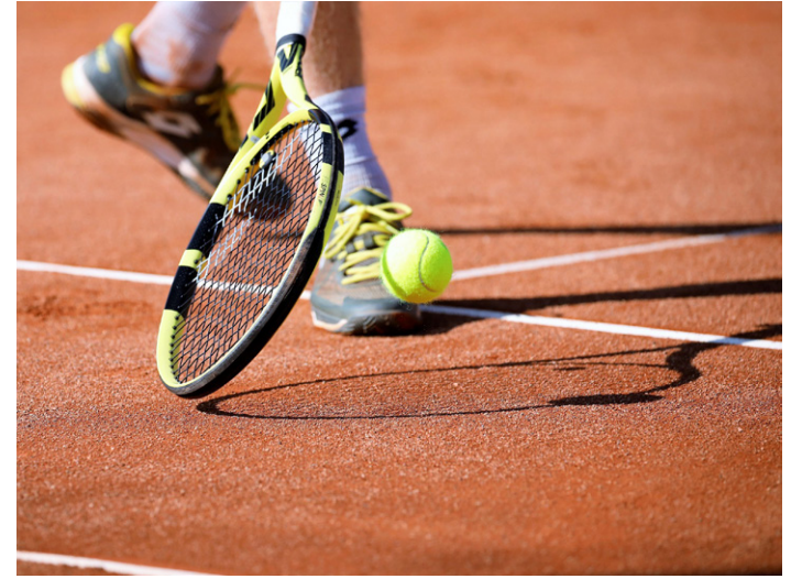
Tennis on yksi Pyrkän huveista.

Pyrkän kaukalon jäät ja lumet ovat sulaneet. Virallinen kaupungin tenniskausi alkaa vasta toukokuun alkupuolella, mutta Pyrkän kentät valjastetaan käyttöön hetimiten, jähkä verkot viritetään. Kentänhoitajien mukaan pienet sammalkertymät puuston puoleiselta osalta kenttää poistetaan ennen kauden alkua.