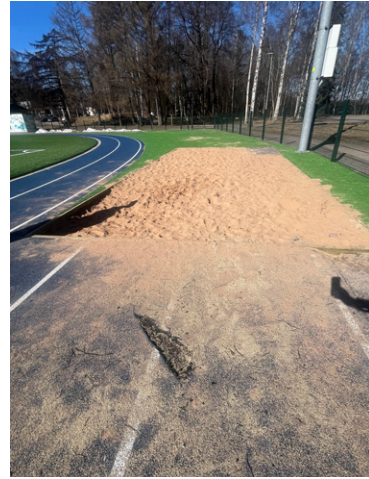
Pituushyppypaikalta puuttuu lankku. Laatikko on asennettu liian lähelle juoksuradan reunaa.

”Päivittäin portaita nousee vähintään 200 ihmistä”, Ahmed arvioi. Tasaisella päivätahdilla se tarkoittaisi noin 45 000 nousijaa vuodessa. 🏠