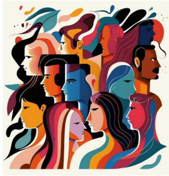
Jokaisella on tarina.