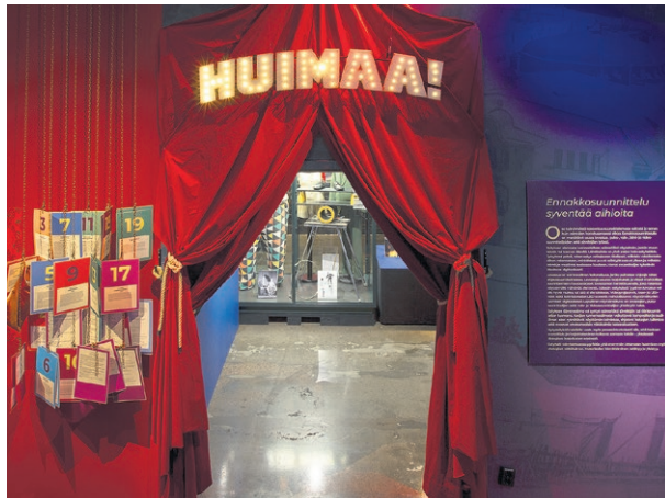
Huimaa! Sirkuksen taikaa ja tarinoita on avoinna Teatterimuseossa 10.1.2027 saakka.

Perinteisen sirkuksen rinnalle alkoi 1990-luvulta lähtien kehittyä uudenlaisia ideoita: vaikutteita otettiin nykytanssista, populaarikulttuurista ja kuvataiteista. 2000-luvulla suomalaiset nykysirkusryhmät ovat menestyneet kansainvälisillä näyttämöillä ja tehneet Suomesta arvostetun nykysirkusmaan.