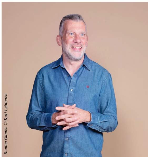
Rumon Gamba