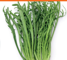
Herba Stella Miellyttävän hapan, mausteinen ja hieman suolainen.