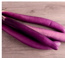
Japanilainen munakoiso Pitkät, hoikat munakoisot sopivat kuorimatta esim. grillaukseen tai wokkeihin.