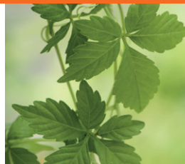
Kuolemattomuuden yrtti Pitkän iän salaisuus? Kaunis köynnöstävä teeyrtti.