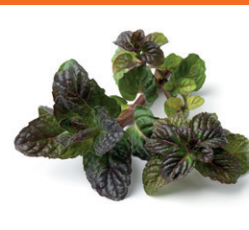
Musta herukkaminttu Huumaava tuoksu ja loistava lisä teehen tai maustamiseen.