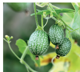
Viidakkokurkku Nopeasti kasvava lajike, käytetään salaateissa tai säilöttyinä.