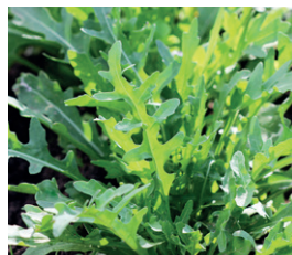
Wasabino Miellyttävän kirpeä maku muistuttaa piparjuurta ja wasabia.