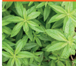
Sitraunaverbena eli lippia Voimakas sitruunan tuoksu, loistava teehen ja marinadeihin.