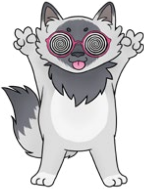
Piirros: Tanita Heinonen