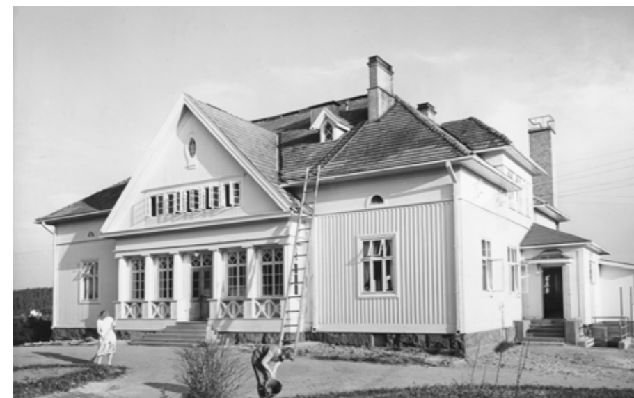
Nokian Taivalkunnassa sijaitseva Alastalon kartano on yksi Tarinakahvilan kokoontumispaikoista tulevana syksynä Nokialla.

Nokian kaupungin kokoelmiin. Tarinakahvilan toimintamallin toivotaan saavan jatkoa sekä laajenevan muihin kuntiin.