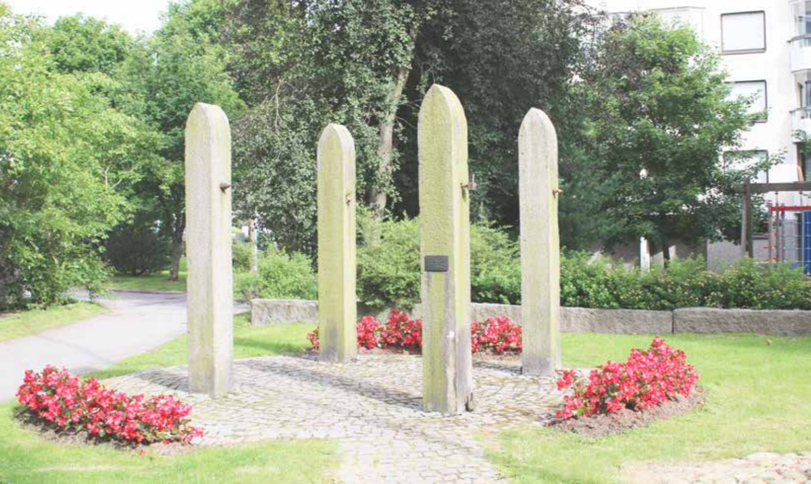
Työläiskorttelin muistomerkki Amurissa. Kuralan Puuvillatehtaankadun puoleisen portin kivipylväät jätettiin kerrostalon pihaan muistoksi menneistä ajoista kun puurakennukset 1970-luvulla purettiin.