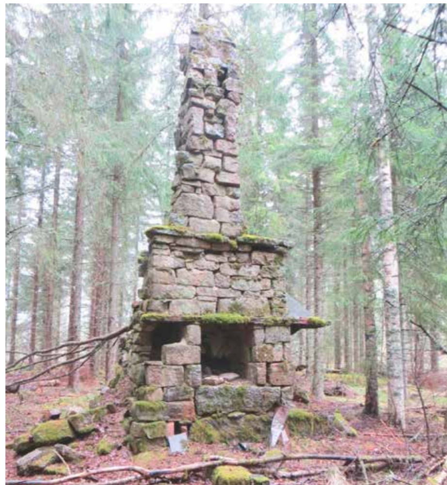
Miikka Kumpulainen/Keski-Suomen museo

Nopeimmin mukaan adoptiotoimintaan ehti Keski-Suomen museo, jossa adoptoi-