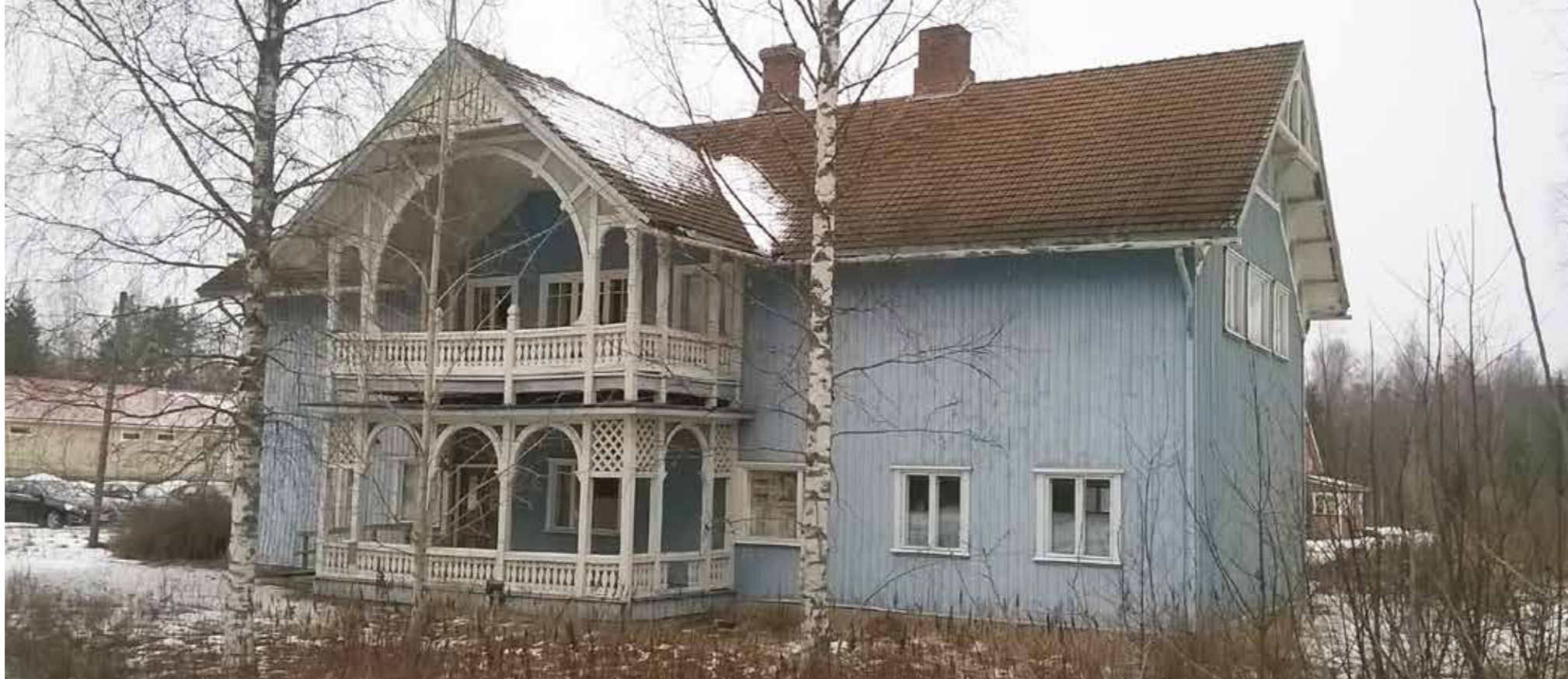
Kuutolan komea kuisti on edelleen maamerkki asemalle tultaessa.