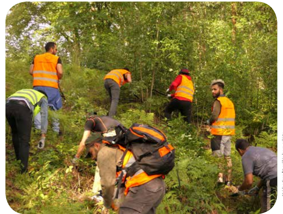
Ympäristöhoitotalkoot ja kalastusta Pohtiolammella.