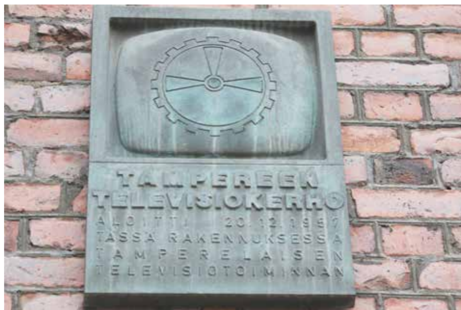
Ensimmäiset TV-lähetykset saivat alkunsa Frenckellin tiloissa. Kuva-aihe tulee tuon ajan virityskuvasta.

Tämän ensimmäisen inventointiprojektin jälkeen Pirkanmaan maakuntamuseo sai vielä haltuunsa Erkki J. Kivisen inventointimateriaalin mikä käsitti tiedot Tampereella sijainneista sotamuistomerkeistä. Tässä yhteydessä tallennettiin harjoittelijatyönä myös pro patria -tauluja, vuoden 1918 muistomerkkejä ja hautausmailla sijainneita muistomerkkejä sekä täydennettiin aikaisemman inventoinnin yhteydessä saatuja tietoja. Viimeisin vaihe Pirkanmaan maakuntamuseon muistomerkkien tallennustyössä on ollut Tampereen taidemuseon tekemän Tampereen muistolaatat ja muut muistomerkit-sivuston tietojen vienti Siiri-tietojärjestelmään ja muistomerkkien valokuvaaminen. Tämän tallennusprojektin yhteydessä tallennettiin myös muita kuin