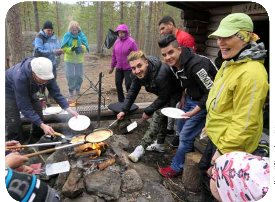
Ympäristöluotsien ja turvapaikanhakijoiden retki Siikanevan suolle.