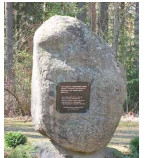
Hämeenkyrössä on palvelukoti Honkalan pihapiirissä Talvisotaan lähdön muistokivi.

muistomerkeistä. Koska maakuntamuseola ei vielä ollut tarvittavaa rekisteriä, ryhdyttiin kulttuuriympäristöyksikössä keräämään tietoa muistomerkeistä Pirkanmaan sotaveteraanijärjestyksiltä. Näin kerätty lista ei ollut kaiken kattava, joten muistomerkkien kartoittamista päätettiin jatkaa toteuttamalla systemaattinen toisen maailmansodan muistomerkkien inventointi Pirkanmaan alueella. Inventointi kohdistettiin toisen maail-