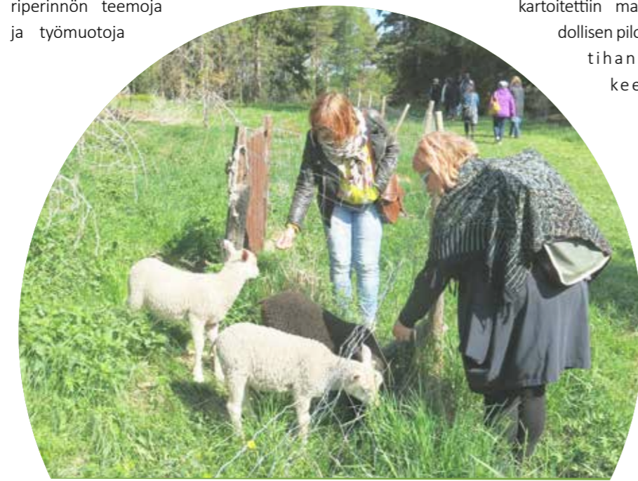
Alkukesän idylliä Reipin tilalla Pirkkalassa.