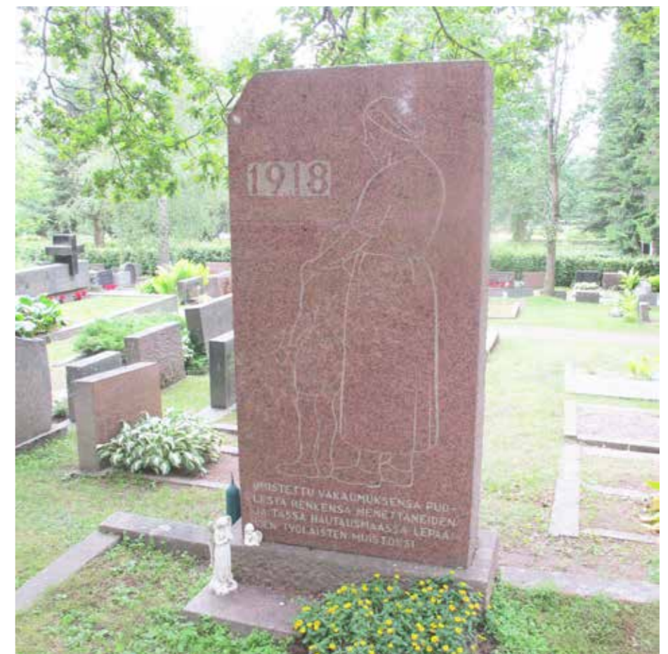
Punaisten puolella vuoden 1918 taistelussa kaatuneiden muistomerkki Akaan hautausmaalla on pytyetty vuonna 1956.