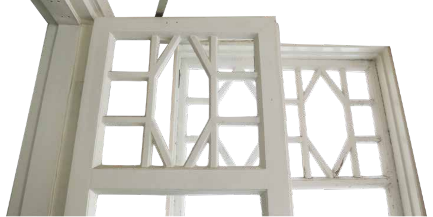
Jukola-talon väliovissa ja kuistin ikkunoissa toistuu sama ikkunajako.

Tehtaan toiminta päättyi vuonna 2008. Siitä lähtien Jukola on ollut tyhjiään ja kylmänä, mikä on vaurioittanut rakennusta. Nyt Jukola on tarkoitus kunnostaa kokous- ja ryhmätyötiloiksi ja infopisteeksi. Näillä