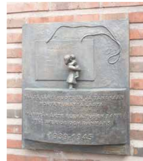
Sotalasten muistomerkki Tampereen rautatieasemalla.