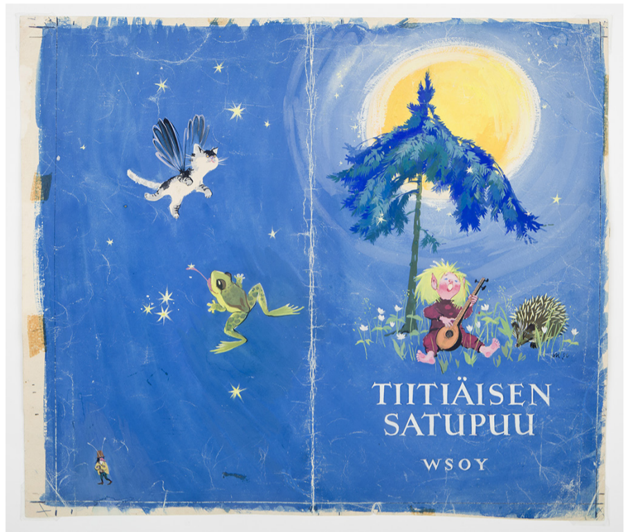
Maija Karma: Kansikuva kirjaan Tiitiäisen satupuu. Guassi, tussi. Tiitiäisen satupuu, 1956. WSOY. Yksityiskokoelma.