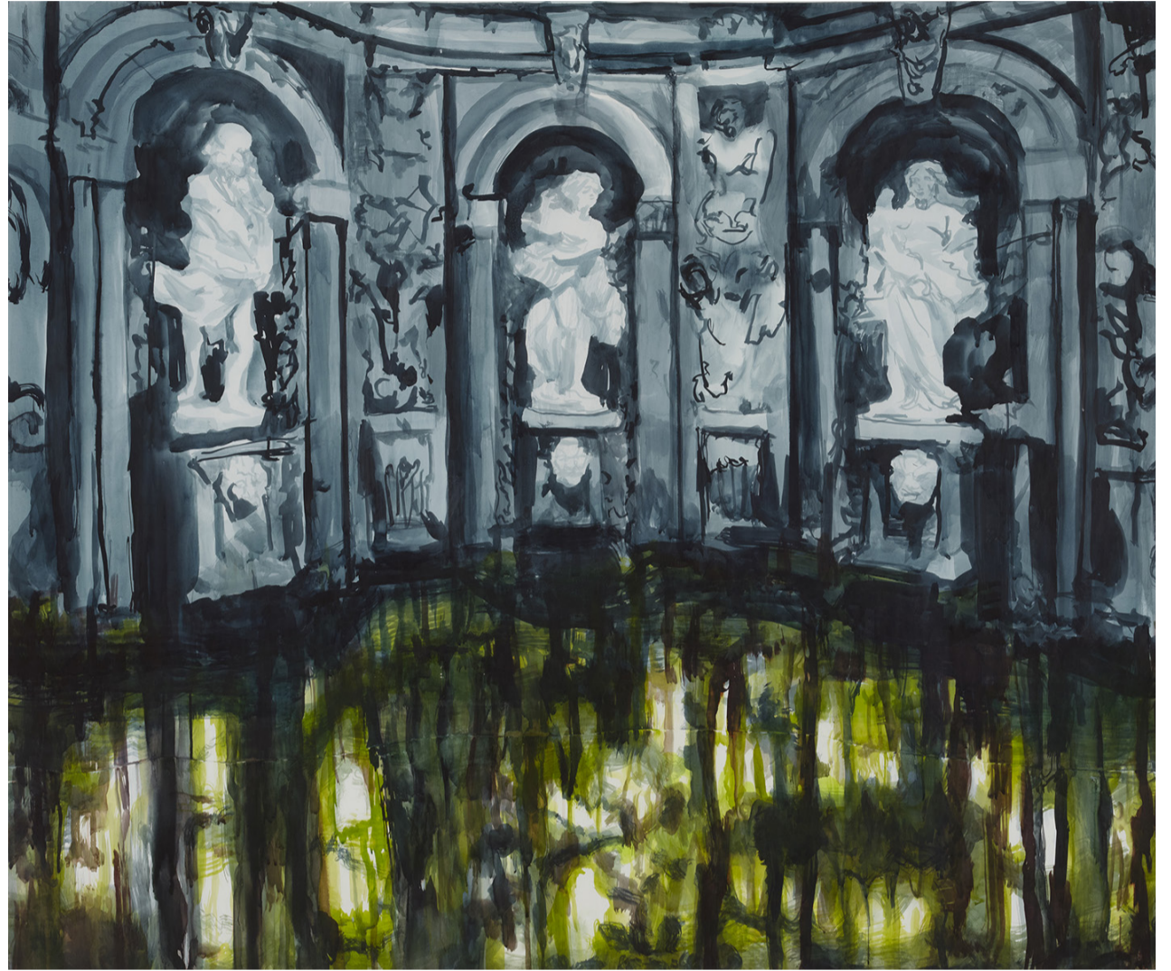
Tamara Piilola, Grotto , 2010. Värillinen muste paperille, 123 x 141,5 cm. Sara Hildénin Säätiön kokoelma.

NÄYTTELY Teos tilassa, tila teoksessa tarjoaa tilasta ja teoksesta toiseen vaihtuvia elämyksiä ja tunnelmia. Lisäksi se herättelee pohtimaan tilan ja teoksen eri ulottuvuuksia. Näyttelyssä käsitellään tilaan, tilallisuuteen, arkkitehtuuriin, rakenteisiin sekä rakennettuun ympäristöön liittyviä aiheita ja kysymyksiä. Näyttely perustuu Sara Hildénin Säätiön kokoelmaan, jota täydentävät näyttelyyn valmistuvat taideteokset.