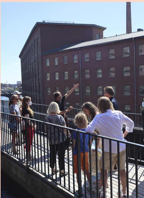
Keskiviikkoisin tutustutaan ulkokierroksella Tammerkosken rannan teollisuushistoriaan

VAPRIIKISSA UPOUDUTAAN satujen maailmaan kesän yleisöopastuksilla! Perhekierrokset, yleisöopastukset sekä aikuisille suunnatut kierrokset Olipa kerran -näyttelyyn kuljettavat osallistujat satujen ihmeisiin sekä tarinoihin tunnettujen satujen taakse. Satujen lisäksi viikoittain tutustutaan Tampereen teollisuushistoriaan Vapriikinraittia kulke- malla, ja 115 vuotta täyttävään Tampereen keskuspaloasemaan draamallisella kävely- kierroksella arkkitehti Wivi Lönnin johdolla. Viikoittain järjestetään myös Postimuseoon perhekierroksia Viestinviejät -näyttelyyn sekä AR-teknologiaa hyödyntäviä kaupunkikierroksia Tampereen viestintähistoriaan. Tervetuloa opastuksille!