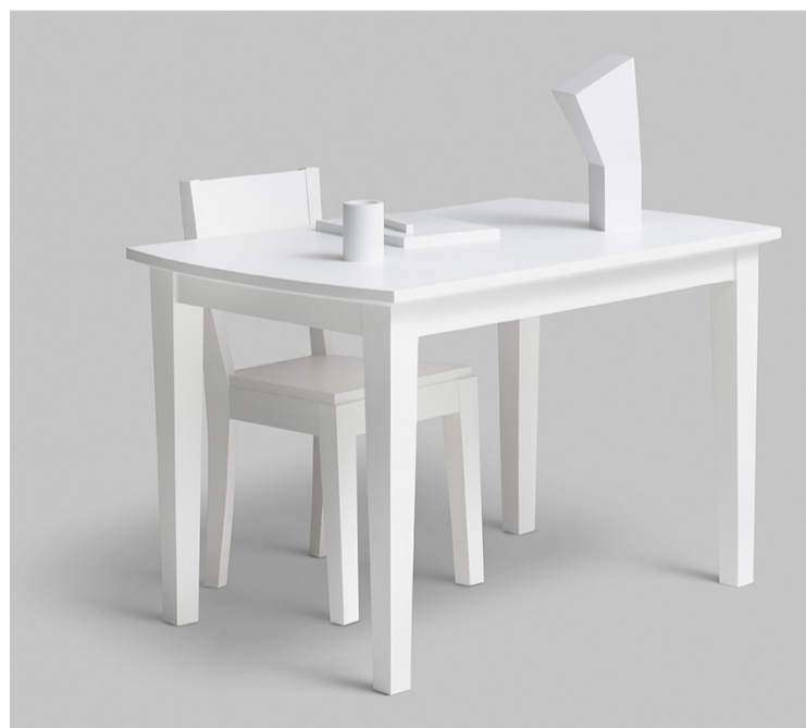
Antti Oikarinen, Tämän teoksen ajattelu , 2022. Koivuvaneri, lateksimaali, tuoli, pöytä, kahvikuppi, luonnoslehtiö, lyijykynä, maljakko ja kuivatut varjoliijat, 112 x 122 x 100 cm. Sara Hildénin Säätiö.